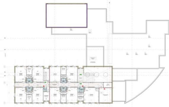
Nieuwe situatie verdieping