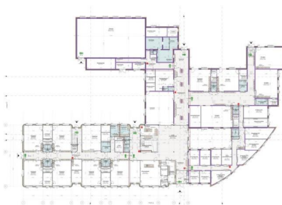
Nieuwe situatie begane grond