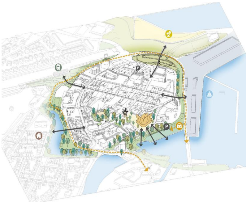
Figuur 2 De ruimtelijke ambities voor het Huis van Cultuur en Bestuur.