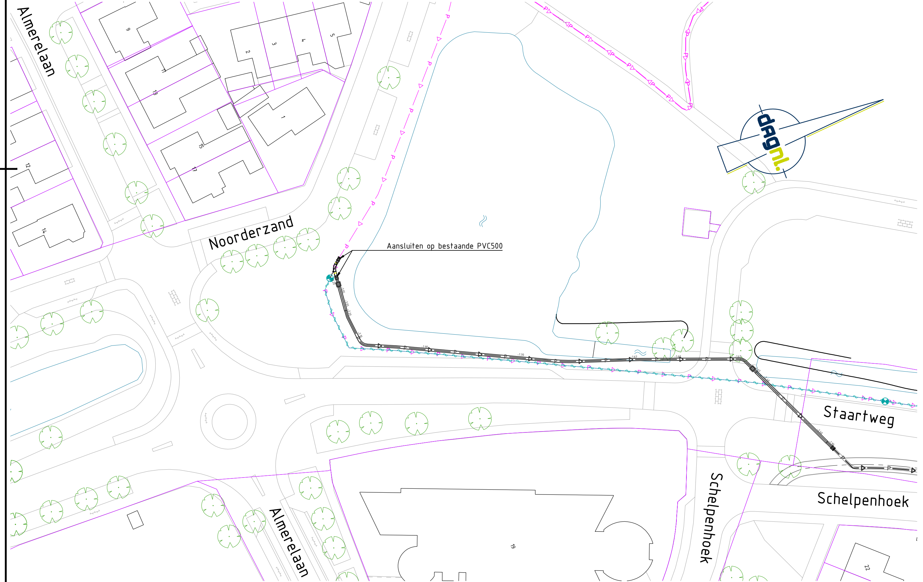
DEELSITUATIE 1 schaal 1:500