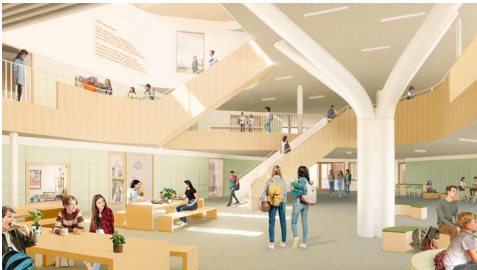
Figuur 5: interieur plaza