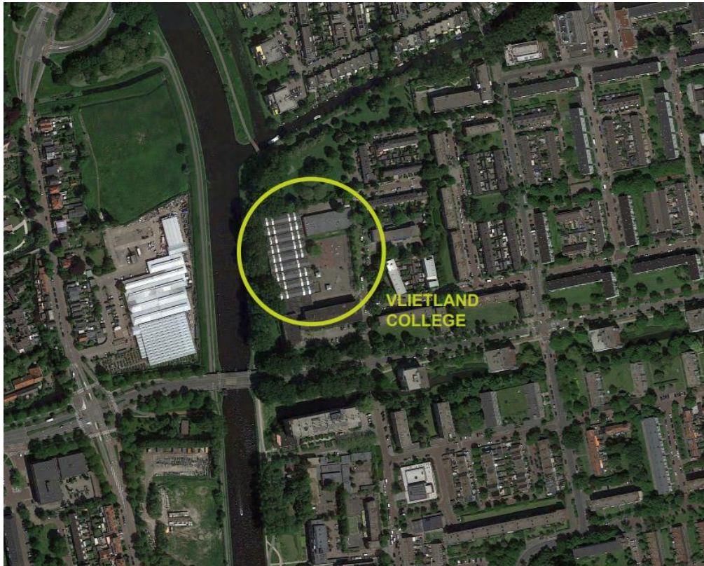
Figuur 2: bovenaanzicht nieuwbouwlocatie