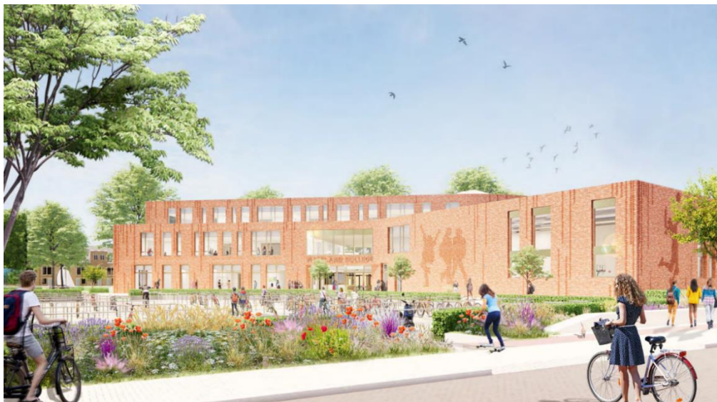
Figuur 3: aanzicht vanaf Johan Wagenaarlaan richting de hoofdentree