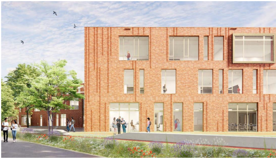
Figuur 4: gevelaanzicht