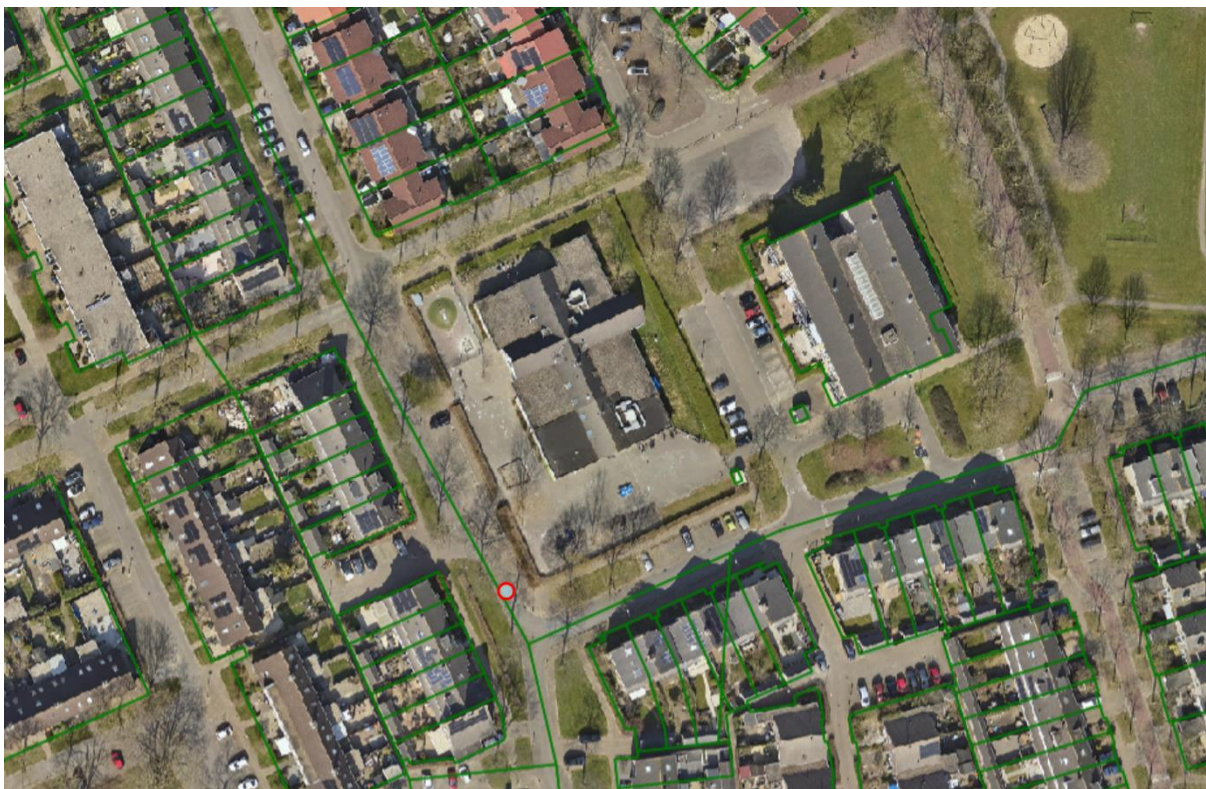
Fig.3 luchtfoto Nieuwbouwlocatie Beverakker 2022.