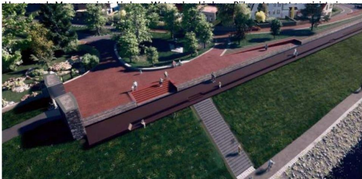
Het ontwerp voor de zelfsluitende kering in Steyl. Onder de donkerrode klep (over de hele lengte), zit de kering die omhoogkomt bij hoogwater.

Met het ondertekenen van de samenwerkingsovereenkomst bekrachtigen gemeenten Venlo en