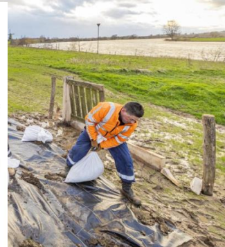
Werk bij Beesel beschadigd raakt.