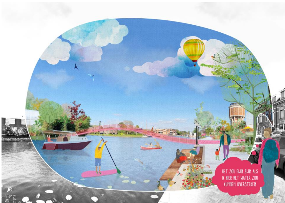
Impressie Tweede groene ring – beeld Posad Maxwan i.o.v. gemeente Leiden

De jury brengt een rangorde aan onder de inzendingen en wijst één winnaar aan. Aan elk van de drie deelnemende teams wordt, na afloop van de tweede ronde een tegemoetkoming in de kosten beschikbaar gesteld van € 20.000,- excl. BTW. Er dient dan een geldige inzending te zijn en de uitwerking moet minimaal worden beoordeeld als 'voldoende'.