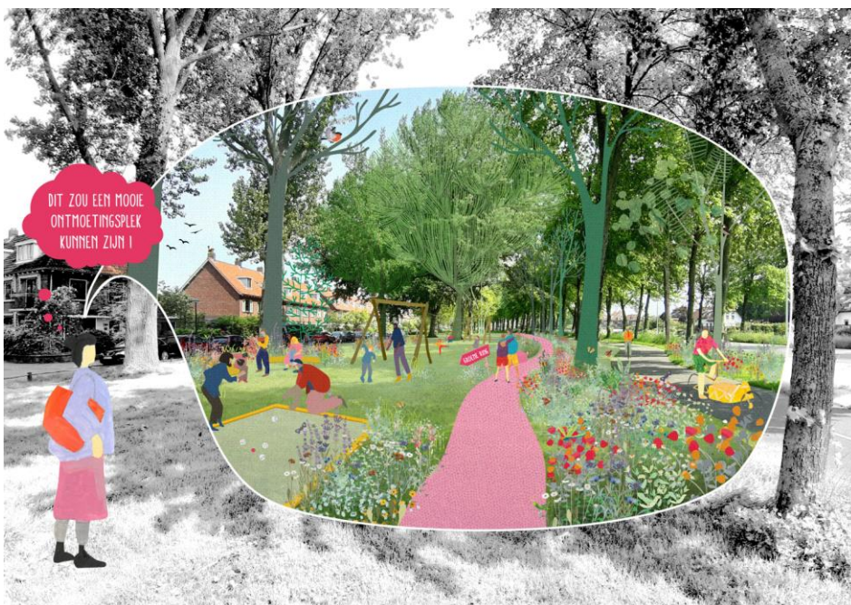
Impressie Tweede groene ring – beeld Posad Maxwan i.o.v. gemeente Leiden

Inwoners van Leiden en buurgemeenten wandelen of fietsen vanuit huis, via aantrekkelijke en toegankelijke groene routes en waterlopen naar de Tweede groene ring om te wandelen, sporten, spelen, verblijven, elkaar te ontmoeten en andere delen van de stad en regio te ontdekken.