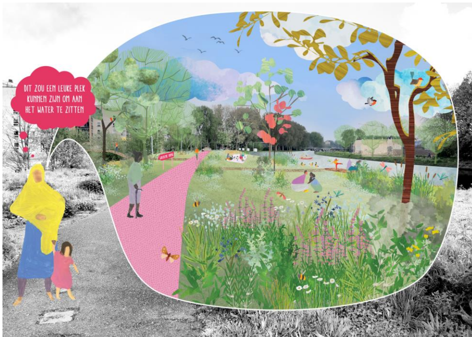
Impressie Tweede groene ring – beeld Posad Maxwan i.o.v. gemeente Leiden

De ontwikkeling vraagt een lange adem en zal stapsgewijs gaan. We kunnen wel op korte termijn starten. Op de Tweede groene ring zijn nu al veel mooie en waardevolle plekken en er zijn diverse ontwikkelingen gaande. Het concept voor de Tweede groene ring moet richting geven aan een stapsgewijze uitvoering. Totdat het nieuwe concept bekend is gebruikt de gemeente de Tweede groene ring als werktitel.