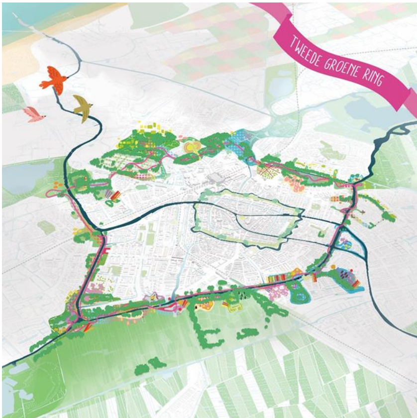
Verbeelding van de Tweede groene ring en ligging in de stad en omgeving

Leiden heeft de ambitie om een van de gezondste steden van Nederland te zijn en een van de opgaven waar Leiden aan werkt is een groen-blauw raamwerk om de stad leefbaar en aantrekkelijk te houden. Onderdeel hiervan is de Tweede groene ring, het symbool van een leefbare, gezonde, biodiverse en klimaatadaptieve stad. De mogelijkheid voor bewoners om te bewegen en vitaal te blijven.