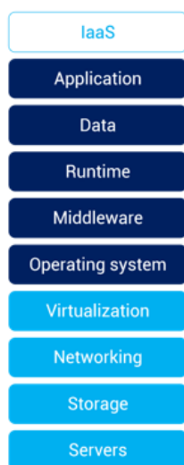
FIGUUR 3: CLOUD UITGANGPUNTEN

In onderstaand schema is de demarcatie aangegeven voor de gewenste situatie waarbij het donkerblauwe deel door gemeente Doetinchem wordt onderhouden.