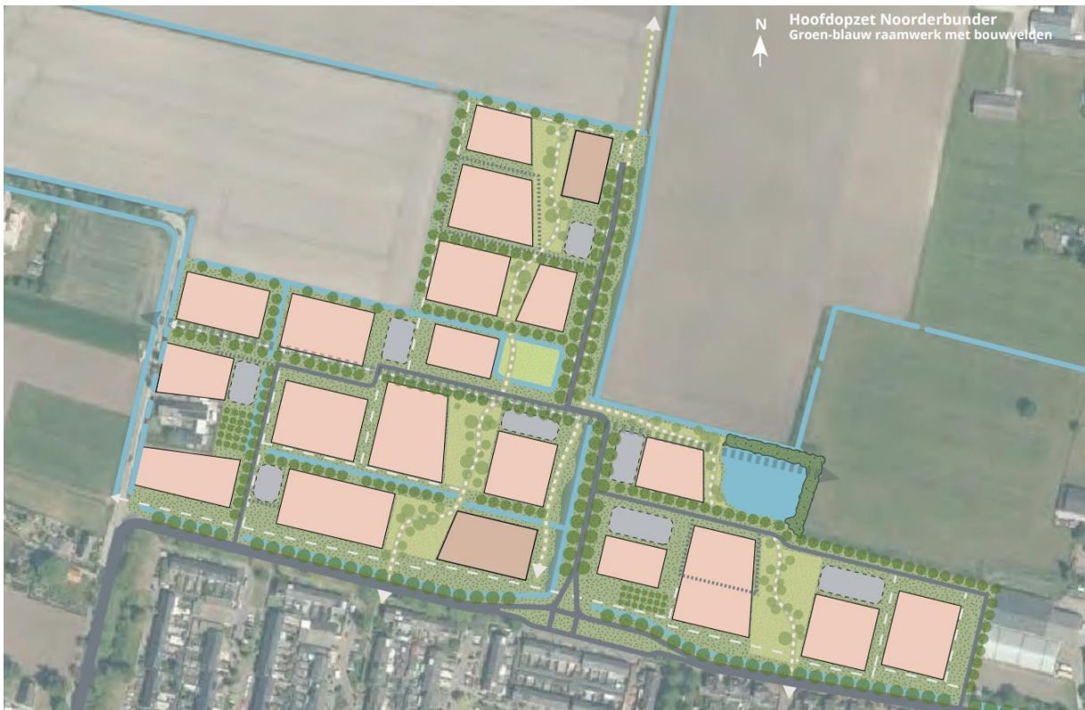
Figuur 1 - Hoofdropzet stedenbouwkundig plan