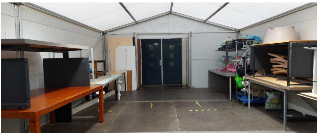
TIJDELIJKE WAS- DOUCHE- EN TOILETRUIMTE (C)