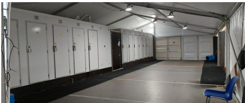
TIJDELIJKE WAS- DOUCHE- EN TOILETRUIMTE (A)