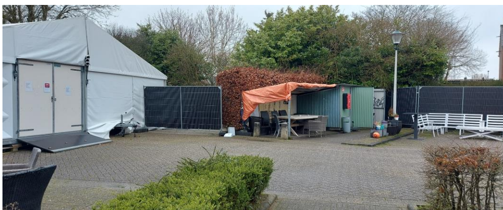
ACHTERTERREIN (C), noord