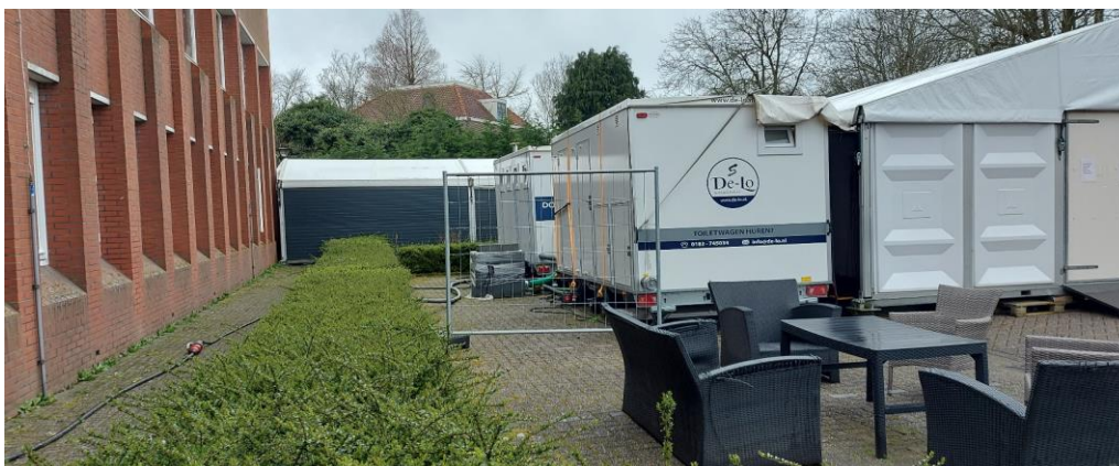
ACHTERTERREIN (A), noord