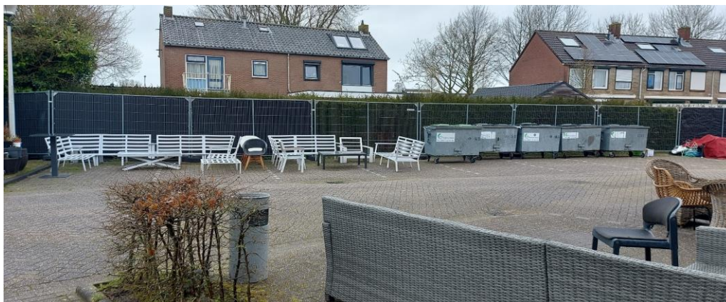
ACHTERTERREIN (D), noord