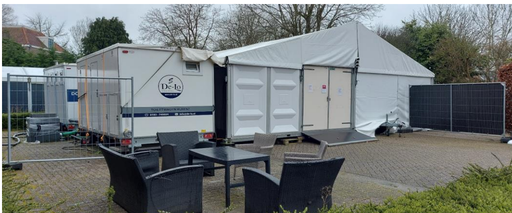
ACHTERTERREIN (B), noord