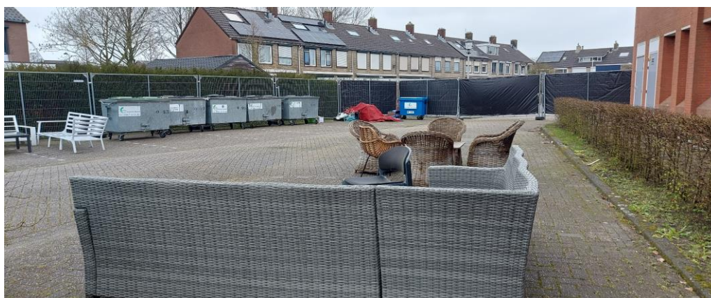
ACHTERTERREIN (E), noord