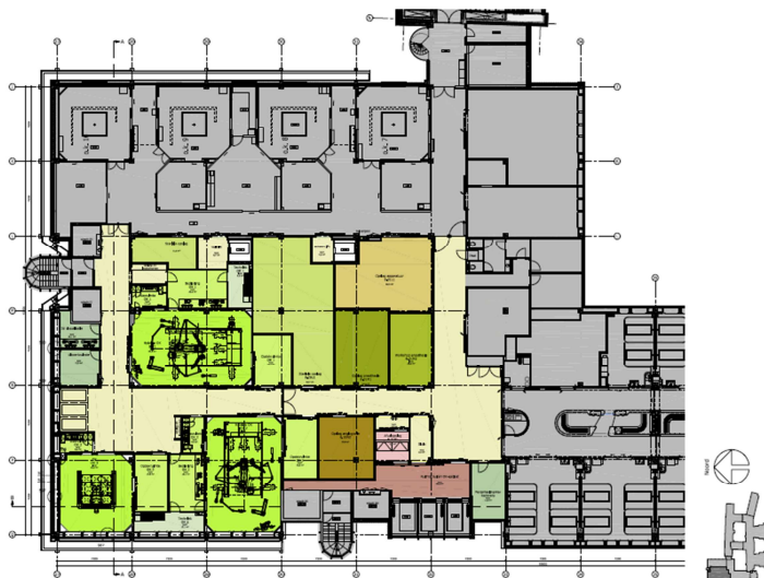
6 e verdieping

Het werk bestaat uit het realiseren van twee hybride operatiekamers en één reguliere operatiekamer met de bijbehorende neven ruimtes. Een hybride operatiekamer is een combinatie van een conventionele, steriele operatiekamer en een angio & interventiekamer.