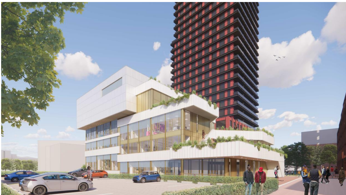
Figuur 3: Impressie zuidoostzijde (aan bovenstaande afbeelding kunnen geen rechten worden ontleend).