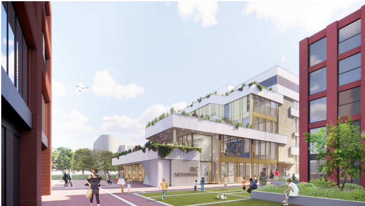
Figuur 2: Impressie IKC vanaf buurtplein (aan bovenstaande afbeelding kunnen geen rechten worden ontleend).