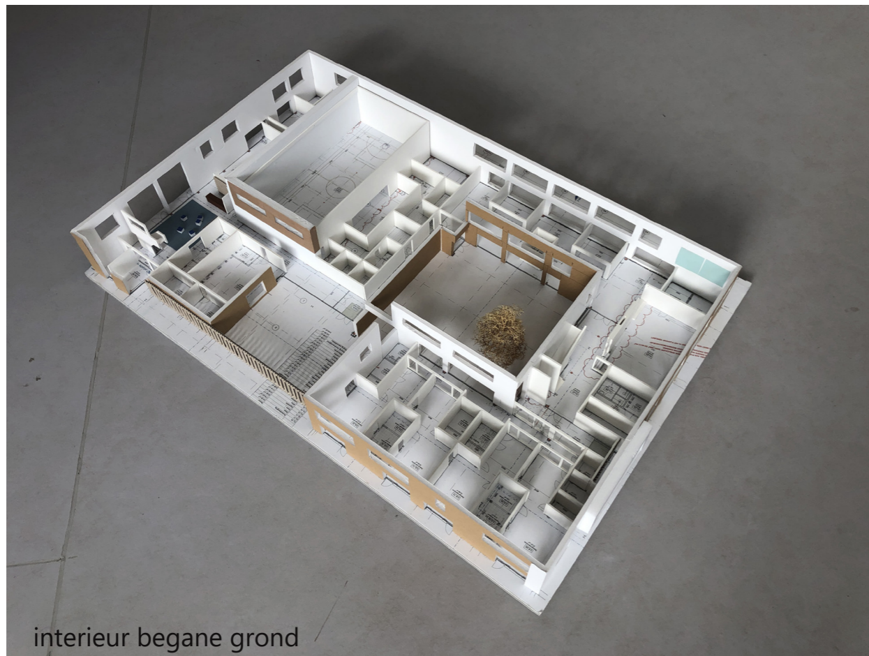
interieur begane grond