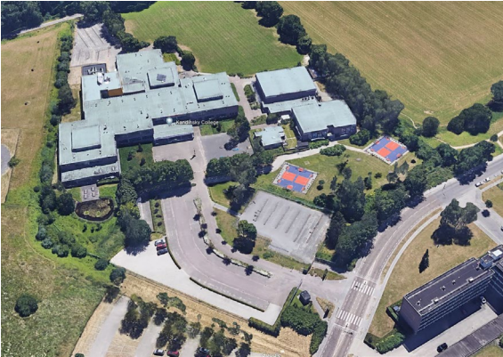
View van bestaande situatie