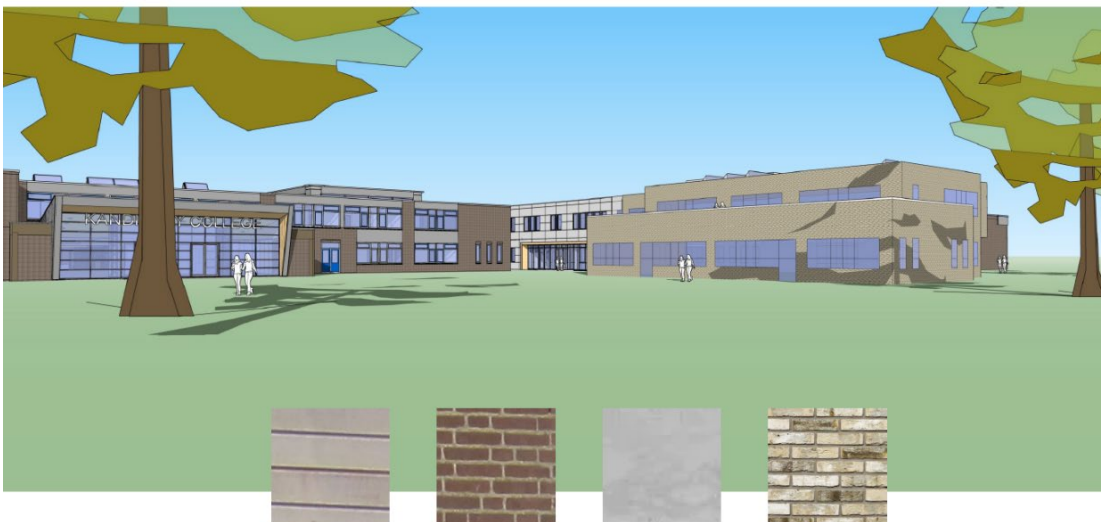
View van bestaande situatie met materialisatie