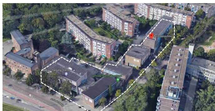
Figuur 1: Locatie Nicolaasschool

Daarnaast is door de Gemeente, met inspraak van de RVKO, een Nota van Uitgangspunten (NvU) opgesteld, waarin de stedenbouwkundige randvoorwaarden zijn opgenomen voor het project en de architectonische beeldkwaliteit wordt omschreven. Deze NvU is leidend voor het uiteindelijke ontwerp en zal aan geselecteerde partijen in de gunningsfase verstrekt worden.