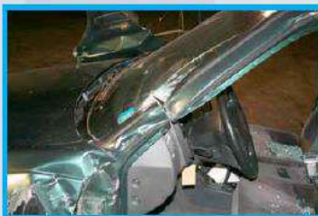
1. Knip de A-stijl circa 15 centimeter boven het dashboard door.