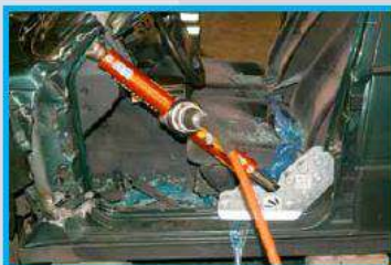
4. Plaats de ram tegen de ramsteun en net boven het dashboard.