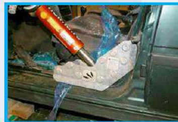
3. Plaats de ramsteun tegen de B-stijl.