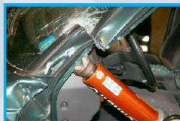
5. Druk de ram uit elkaar en het dashboard zal een 'roll' maken over de voorwielen.