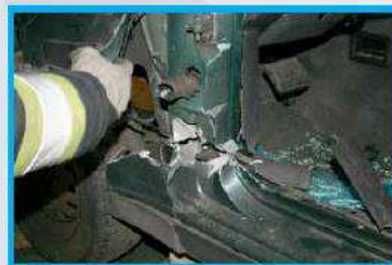
2. Knip de A-stijl horizontaal met de dorpel zo ver mogelijk in.