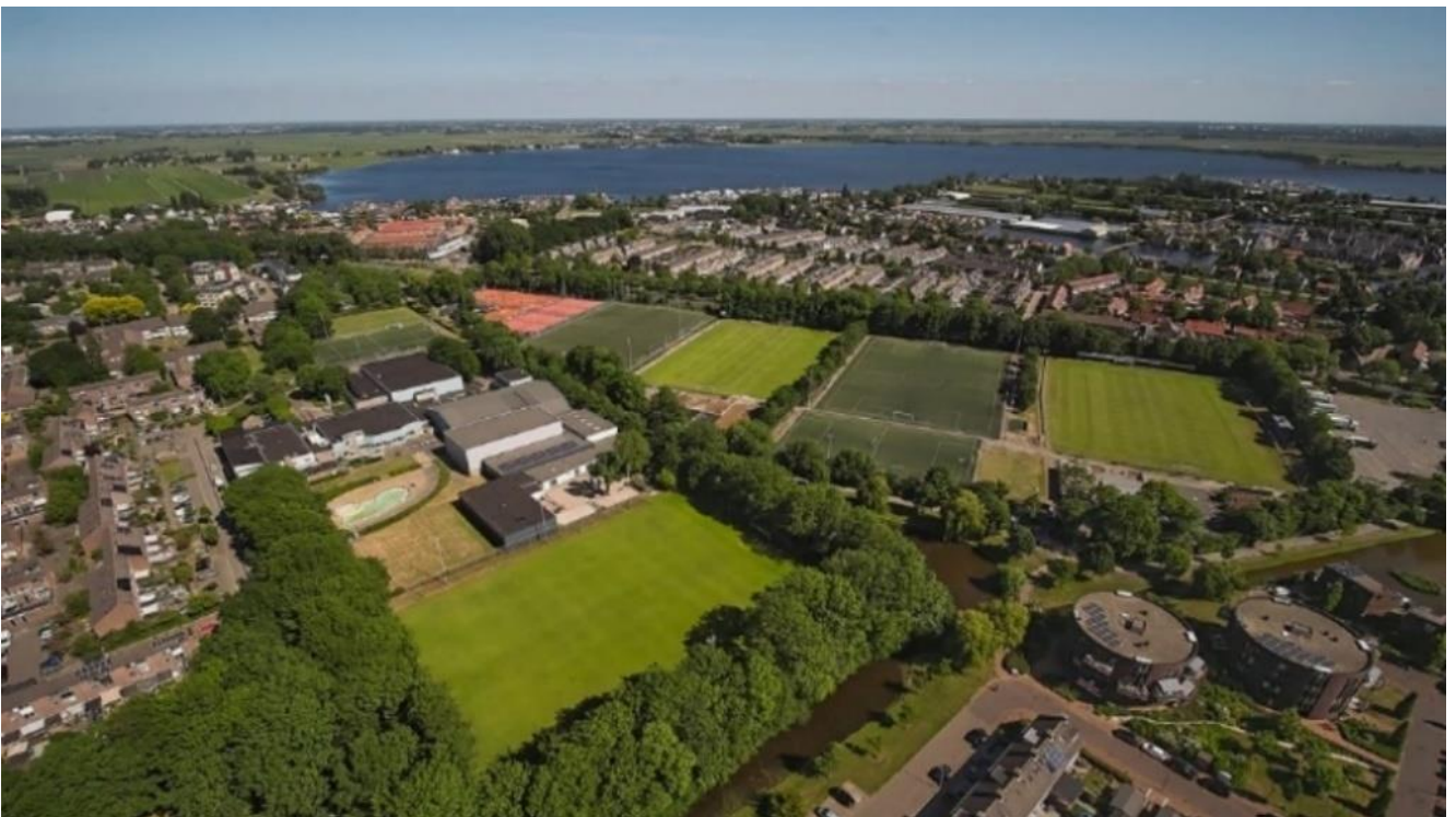
Afbeelding 1: Huidige situatie

De directe aanleiding voor de verbetering van het Sportpad is veelzijdig: de vraag om vernieuwing van zwembad en sporthal de Tweesprong, de plannen voor een KC van SSBA en Kindkracht 0/12, een gezamenlijk onderkomen voor de fusieclub E.M.M. '21 (D.O.S.R., WVC en met de intentie ook Hockeyclub Alkemade), en andere sport- en culturele verenigingen die de inwonersaantallen en de vraag vanuit inwoners zien veranderen in de komende jaren. Gezamenlijk willen alle partijen bijdragen aan het op peil brengen van het sport- en cultuurniveau in Roelofarendsveen. De huidige infrastructuur van het Sportpad is niet toereikend voor de intensivering van het gebruik. Dat vraagt om een integrale benadering van programma en verkeer.