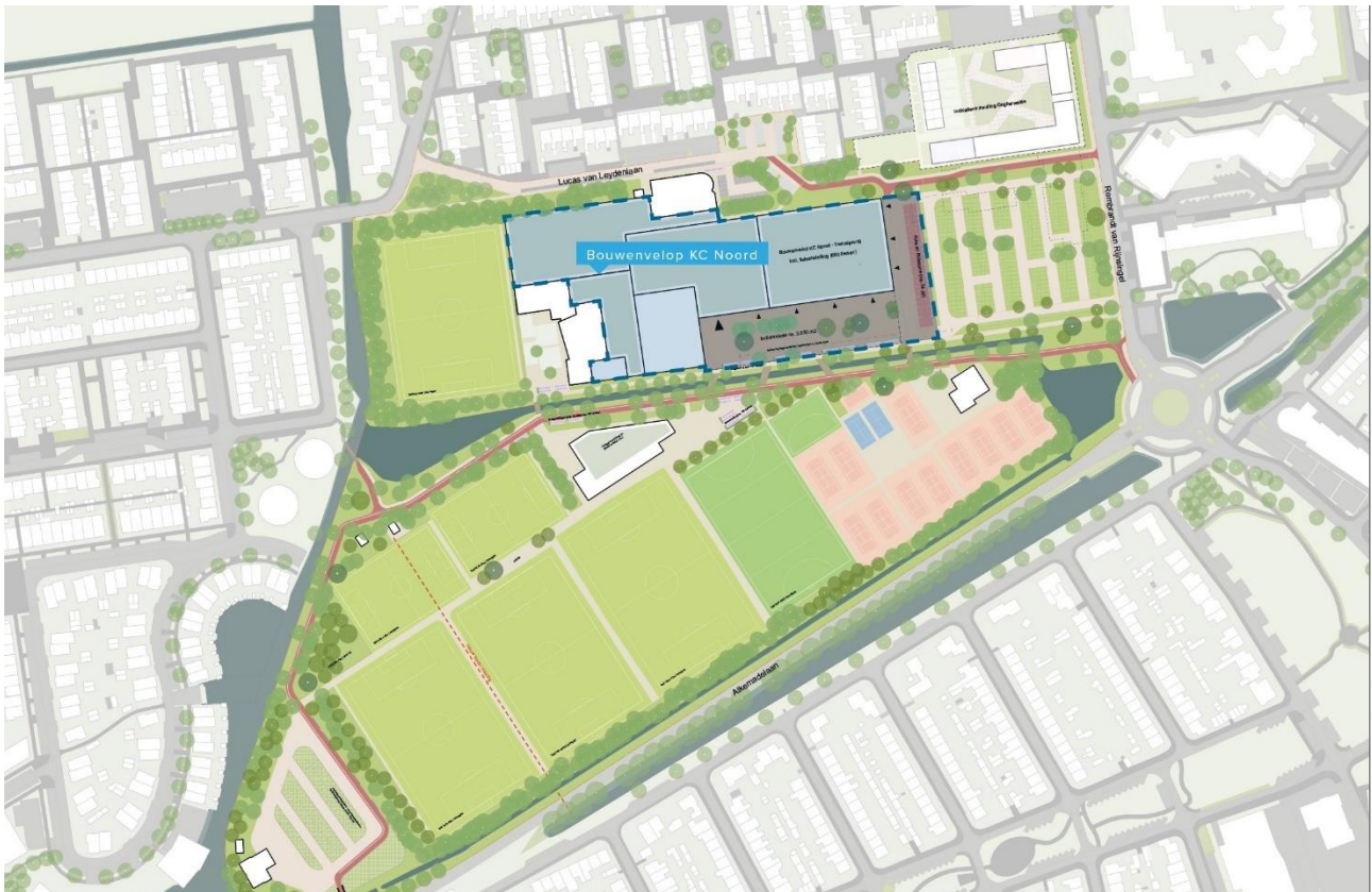
Afbeelding 2: Overzichtskartaal Sportpad Roelofarendsveen