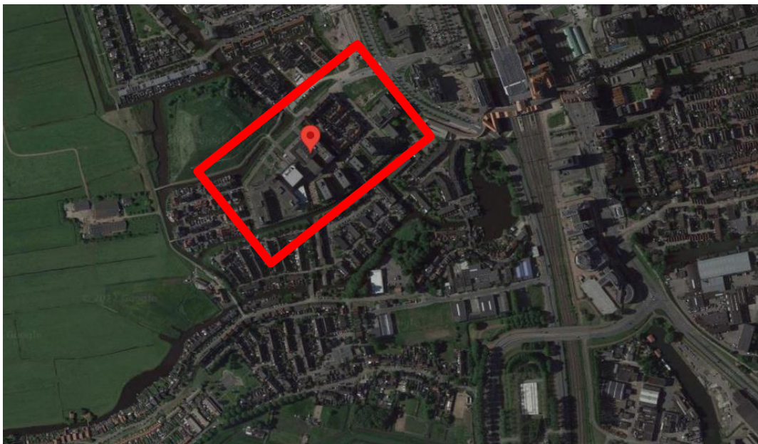
Regiocollege: Locatie Cypresseshout, Zaandam.

Het Regio College heeft na afweging van enkele scenario's besloten om de huidige locatie aan de Cypresseshout in Zaandam volledig te vernieuwen door middel van een ingrijpende renovatie van de bestaande gebouwen. Deze huidige locatie biedt voldoende ruimte gelet op studentenprognoses en onderwijsconcepten, maar voldoet qua type ruimten, inrichting en gebouwtechniek niet meer volledig. Er is behoefte aan een grondige verbouwing en renovatie, om de locatie aan te passen aan de duurzaamheidseisen van deze tijd en de wensen voor modern beroepsonderwijs.