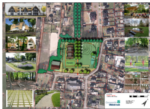
Toekomstige situatie, variant D