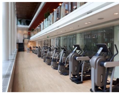
Afbeelding voormalige fitnessruimte