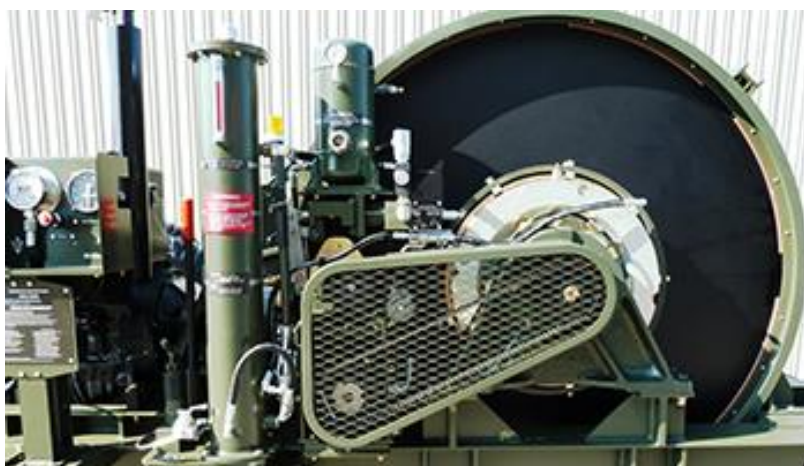
Voorbeeld van een remtrommel

Op Vliegbasis Leeuwarden zal aan beide zijden van de Hoofd- en Secundaire baan de huidige afreminstallatie worden vervangen. Er worden dus 4 AAS geïnstalleerd. Met de installatie van de nieuwe vliegtuigafreminstallatie's beschikt vliegbasis Leeuwarden straks over een modern afremsysteem dat gecertificeerd is voor het afremmen van diverse soorten gevechtsvliegtuigen waaronder de F-35. Het nieuwe afremsysteem is al aangelegd op de Hoofdbaan van Vliegbasis Gilze Rijen en de Parallelbaan van Vliegbasis Volkel.