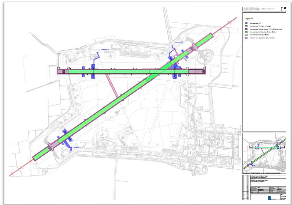
Figuur 1: het werkgebied

Documenten noodzakelijk om te komen tot een gezamenlijke planning dienen zowel in het Nederlands als ook in het Engels te worden opgesteld.