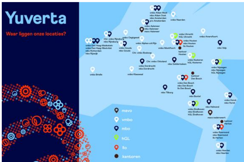
Figuur 2. Opleidingsportfolio

De instelling is ingebed in traditionele land- en tuinbouw productiegebieden omgeven door de grootste steden van Nederland; Amsterdam, Rotterdam, Den Haag, Utrecht, Eindhoven, Nijmegen, Tilburg, 's-Hertogenbosch, Arnhem en Parkstad. In het verzorgingsgebied van de instelling bevinden zich de belangrijkste greenports van Nederland. Het opleidingsportfolio kent zowel een lichtgroene/blauwe invulling (water, food, natuur en milieu) die is gericht op de stedelijke omgeving als een meer donkergroene die gericht is op agroproductie (melkveehouderij, varkenshouderij, teelt). De mbo's kennen in hun portfolio een aanzienlijk deel dier- en paraveterinair-opleidingen.