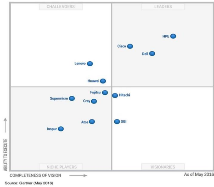
Figuur 1: Magic Quadrant voor modular Servers