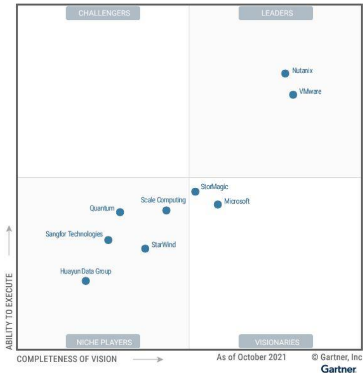
Figuur 3: Magic Quadrant voor Hyperconverged oplossingen

Deze opdracht betreft alleen het leveren en installeren van de hardware inclusief benodigde support. Hieronder wordt verstaan het uitvoeren van de volgende werkzaamheden: