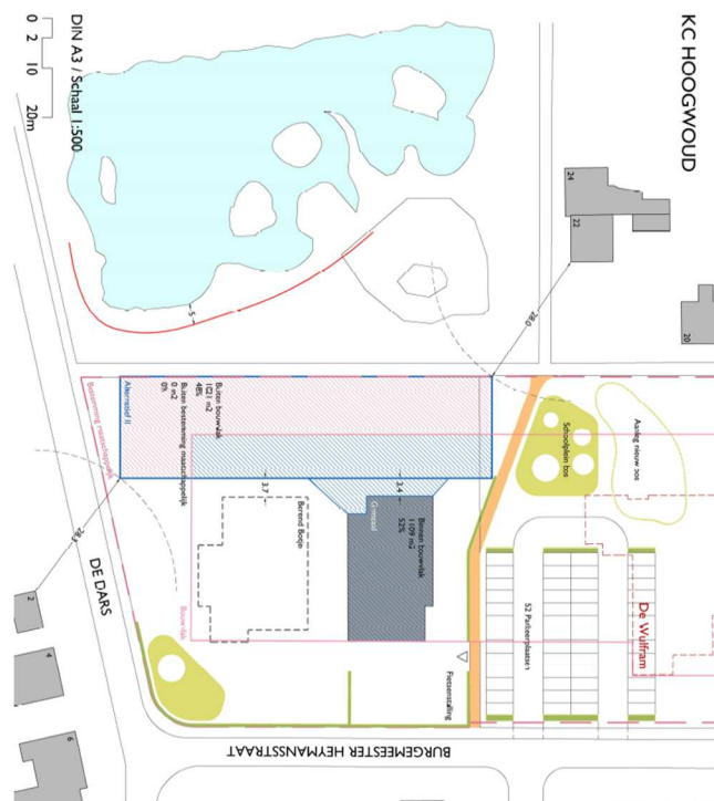
Afbeelding 1: Situatieschets

In het ontwerp is opgenomen een aanpassing aan de bestaande gymzaal zodat er een eenheid ontstaat tussen oud en nieuw. Na realisatie van het kindcentrum wordt de huidige huisvesting van het kinderdagverblijf gesloopt. Hiervoor in de plaats wordt het schoolplein gerealiseerd.