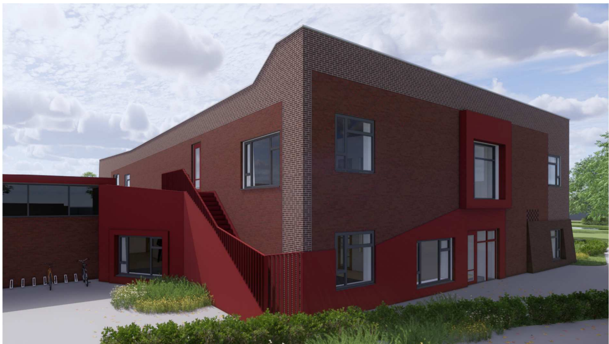
Afbeelding 2 & 3: Gebouwimpressie