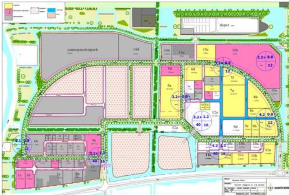
Figuur 2: Plankaart (Roze vlak is kavel 15b)

Op de uitgegeven kavel geldt de bestemming "Bedrijfsdoeleinden I" (figuur 2). De bestemming "Bedrijfsdoeleinden I" laat de vestiging toe van bedrijven die maximaal vallen onder de genoemde categorie uit de bijlage lijst: Staat van Bedrijfsactiviteiten. In bepaalde gevallen is vrijstelling van de maximaal toegestane milieucategorie mogelijk. Tevens is -indien van toepassing- op de kaart aangegeven hoeveel procent van de vereiste parkeerplaatsen minimaal in een gebouwde parkeervoorziening moet worden gerealiseerd.