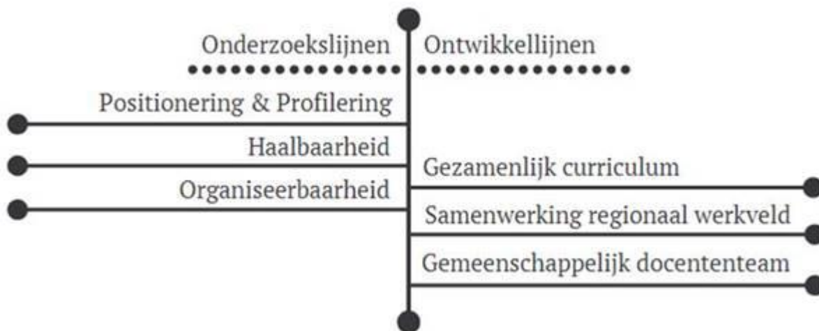
Figuur 5 Doorlopende leerlijnen

De scope van deze bestuurlijke opdracht richt zich primair op het versterken van de samenwerking tussen vmbo basis tot mbo-2 (startkwalificatie). Een projectgroep brengt advies uit aan de vo- en mbo-directeuren via het centrale overlegorgaan. De gehanteerde twee projectlijnen zijn schematisch weergegeven in Figuur 5.