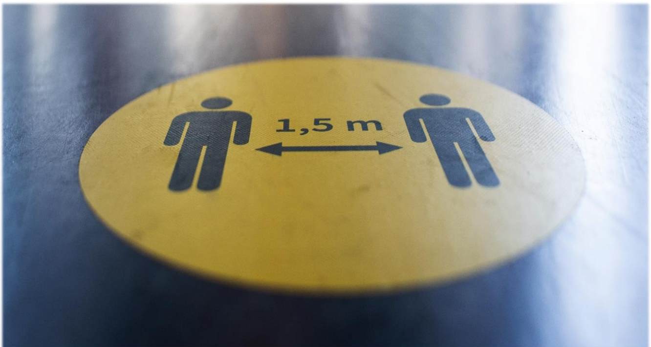
Bewegwijzering in de schoolgebouwen volgens RIVM-voorschriften COVID-19: houd anderhalve meter afstand. (Foto: C&M Landstede Groep).

De resultaten en conclusies van alle onderzoeken zijn gebundeld.