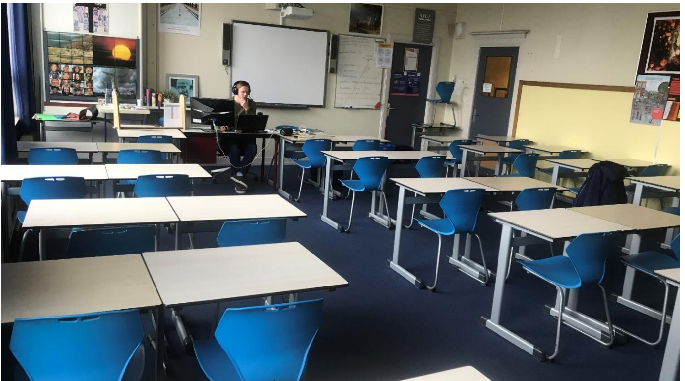
Lesgeven tijdens de COVID-19-pandemie.

Aansluitend op de beloften uit de strategienota wordt, waar mogelijk, duurzaamheid in aanbestedingen meegenomen. Dit komt tot uiting in minimeisen en/of gunningscriteria. Zo is voor het leveren van energie (elektra & gas) aan onze vo-scholen gekozen voor 100% groene energie! Naast duurzaamheid is er aandacht voor innovatie en optimalisatie. Ook krijgen lokale ondernemers een kans en wordt hen in meervoudig onderhandse trajecten de mogelijkheid geboden mee te dingen naar opdrachten voor Landstede Groep.