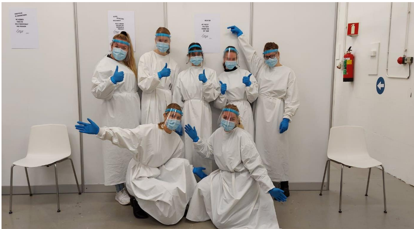
Deskundige assistenten 'bemanning' de COVID-19-teststraat. Een succesvol initiatief van Landstede Groep.