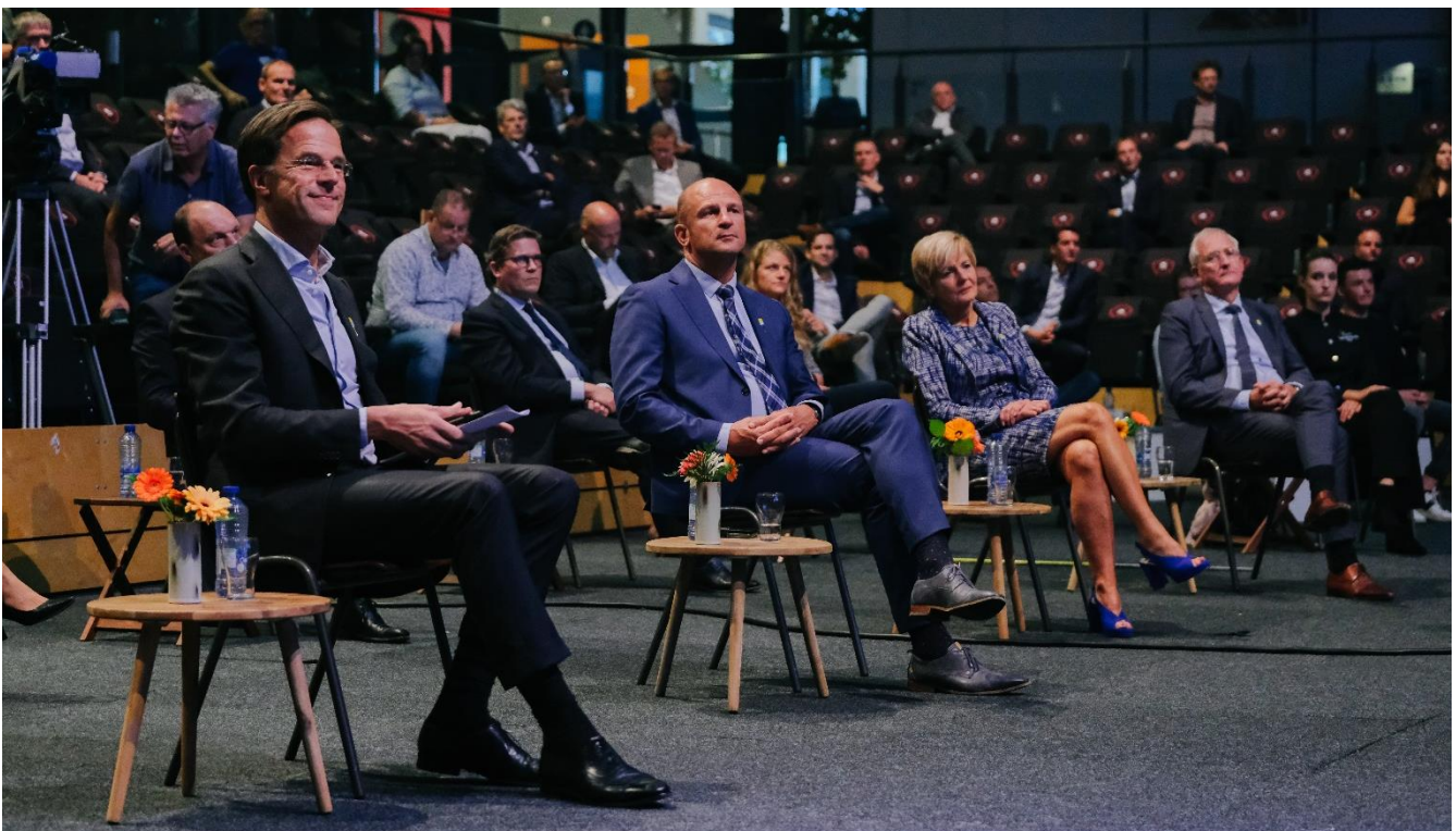
Opening van het schooljaar in aanwezigheid van minister-president Mark Rutte.

Landstede Groep is een onderwijsinstelling met scholen zowel in het voortgezet onderwijs als in het middelbaar beroepsonderwijs. Onderdelen in het jaarverslag, met name in de algemene delen zoals hoofdstuk 1, 5 en 6, kunnen voor zowel het vo als het mbo gelden. Daar waar het specifiek over het vo-onderwijs gaat wordt over leerlingen gesproken. Wanneer informatie over studenten wordt gegeven, met name in hoofdstuk 3, betreft dat de mbo-scholen of stagiaires van hbo-scholen die de stage binnen het vo- of mbo-onderwijs van Landstede Groep volgen.