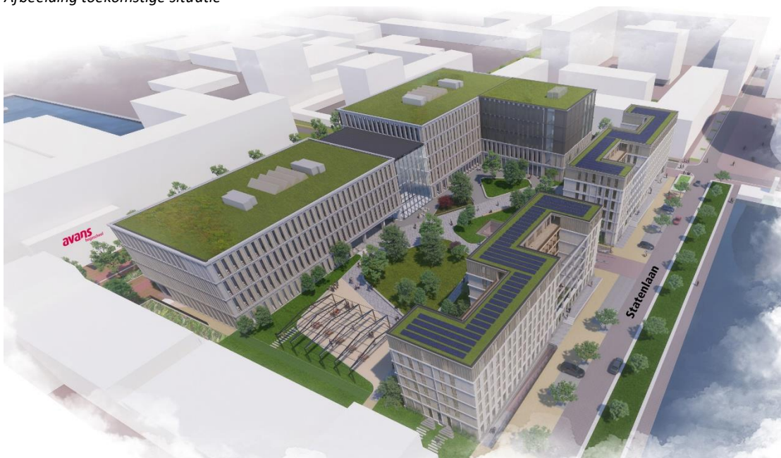
Afbeelding toekomstige situatie