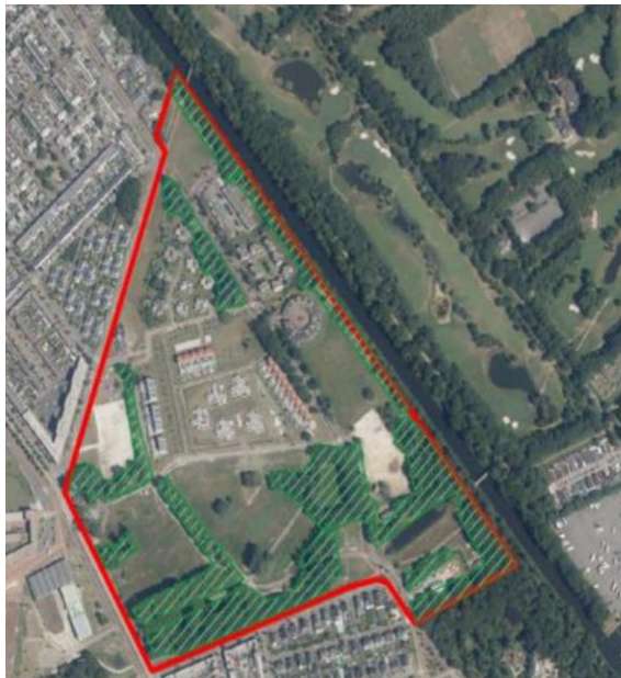
Afbeelding 2: Ter plaatse van bomen in groene arcering kunnen verblijfplaatsen van vleermuizen aanwezig zijn.

LET OP! Een ecologietoets maakt in fase 2 (Ontwerpfase) onderdeel uit van de beoordeling van het Gedetailleerd ontwerp. Dat betekent concreet dat de winnende Inschrijving aan de uitgangspunten van Ecologie zoals boven beschreven zal worden getoetst. De resultaten van de ecologietoets worden gedurende een verificatiegesprek met de winnende Inschrijver besproken. Bij niet voldoen aan de gestelde uitgangspunten wordt Inschrijver eenmalig de gelegenheid geboden om zijn Gedetailleerd ontwerp zodanig aan te passen dat deze voldoet. Bij wederom niet voldoen aan de uitgangspunten van Ecologie behoudt Opdrachtgever het recht om de Inschrijving van Inschrijver ter zijde te leggen en met de volgende in rangorde van de Ontwerpfase het gesprek aan te gaan. Voor deze Inschrijver geldt vervolgens dezelfde procedure.