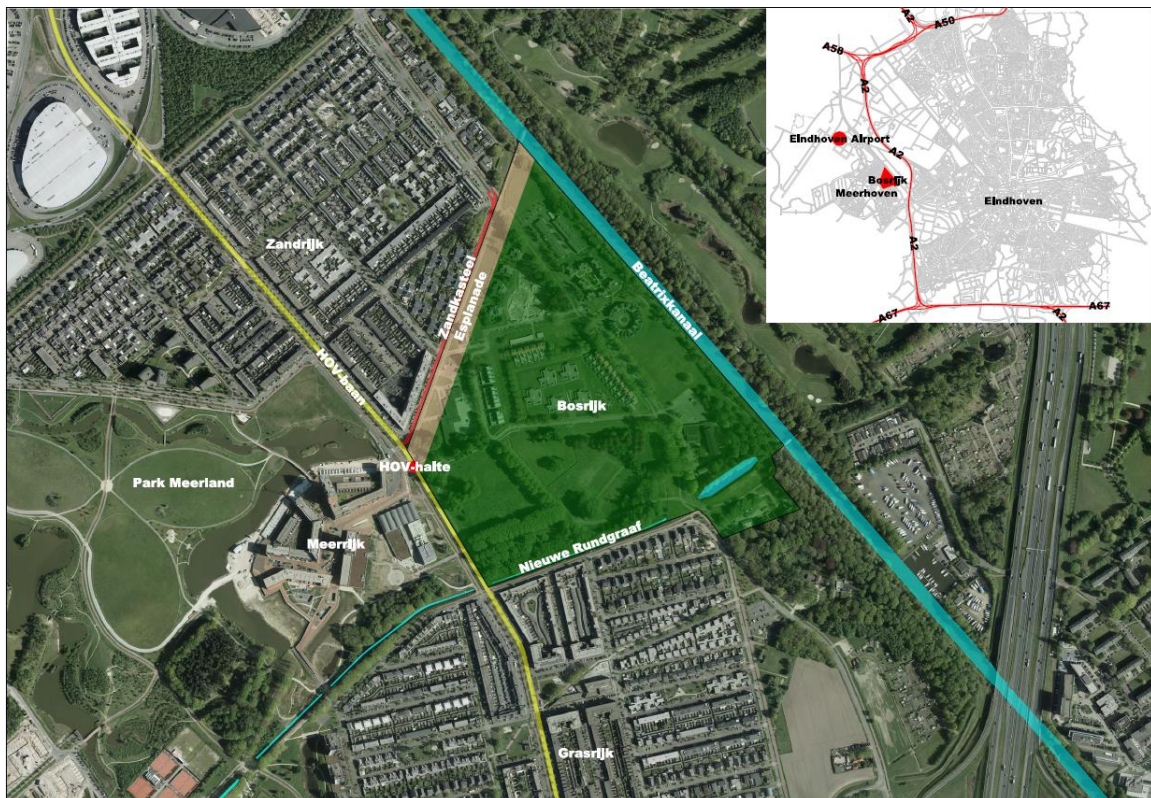
Afbeelding 3 Situering Esplanade