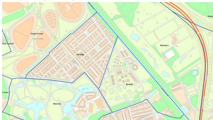
Afbeelding 2b: Specifieker ingezoomd (ligging tussen Zandrijk en Bosrijk).