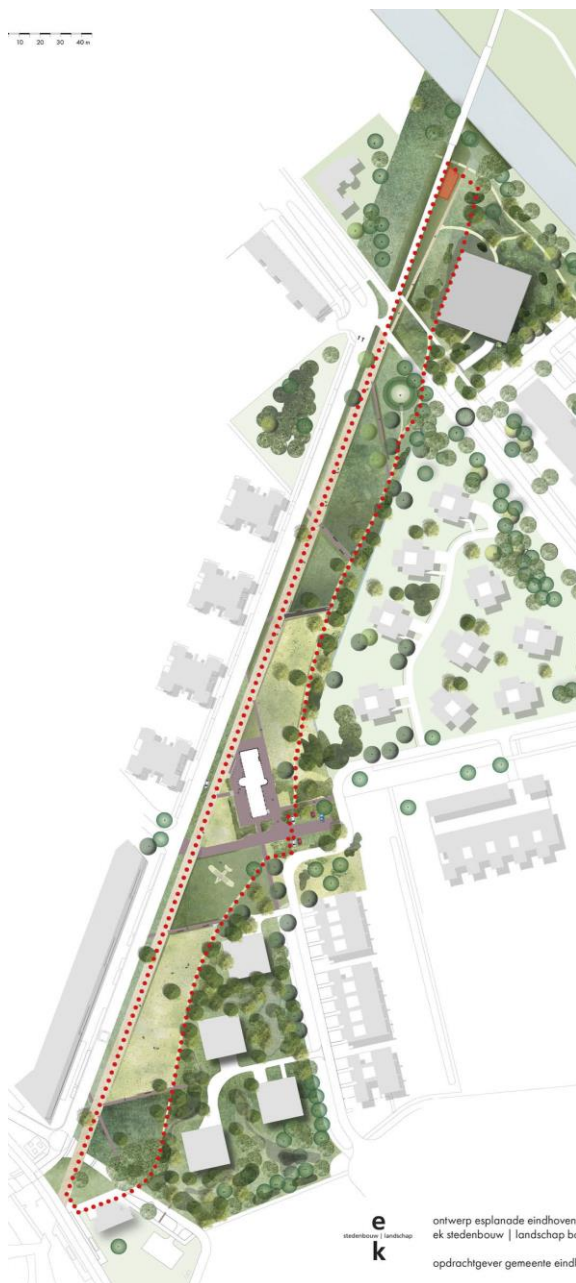
Afbeelding 4: Kaart met geleiding en apotheose