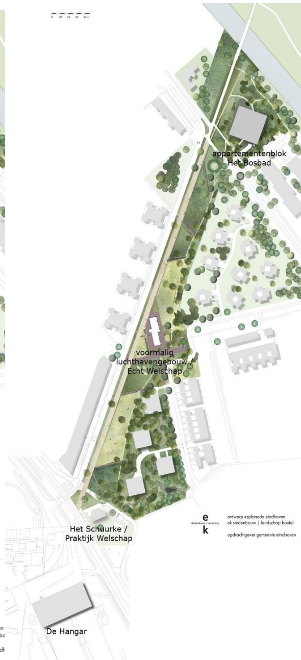
Afbeelding 5: Kaart met locaties en benamingen gebouwen