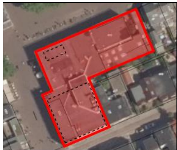
Locatie aan Emmapark