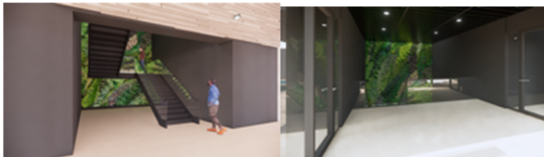
Impressies groenwand begane grond en eerste verdieping*

Een belangrijk element in het ontwerp is de verticale groenwand in het centrale trappenhuis. De groenwand heeft als doel om het gebruik van de trap te bevorderen. De groenwand biedt een diversiteit aan groen en heeft een hoogte van circa 7,25 meter en is 5,2 meter breed. Voor de irrigatie van de groenwand is een aangrenzende technische ruimte gereserveerd. In het plafond zijn aansluitpunten aangebracht voor eventuele groeilampen.