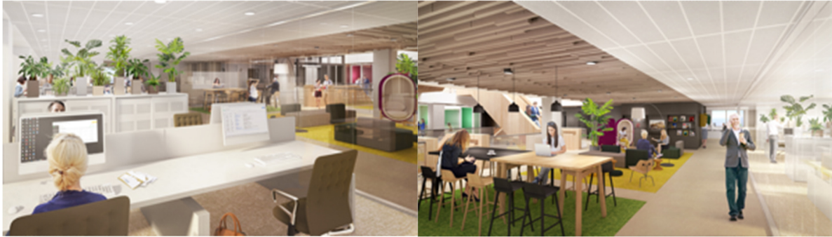
Impressie groen op kantoorverdieping*

*De impressies geven een weergave van de nieuwe Stadswinkel. Hier kan van worden afgeweken.