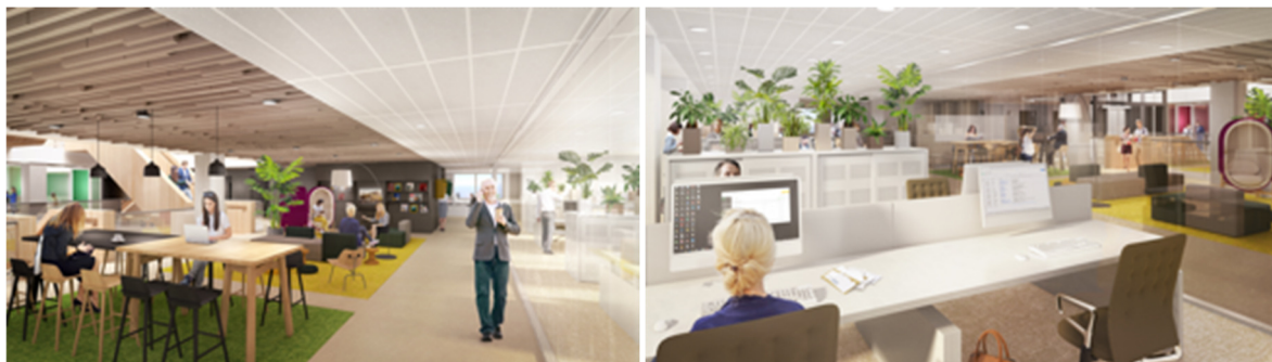
Impressies kantoorverdiepingen (community-gebied en werkgebied)*

Om de vides zijn de community gebieden en dynamische plekken te vinden, gericht op interactie en ontmoeting. Hier is het kleurgebruik ook intensief en kleurrijk. De buitenzone, waar de werkplekken te vinden zijn, zal meer rust uitstralen door neutraal kleurgebruik.