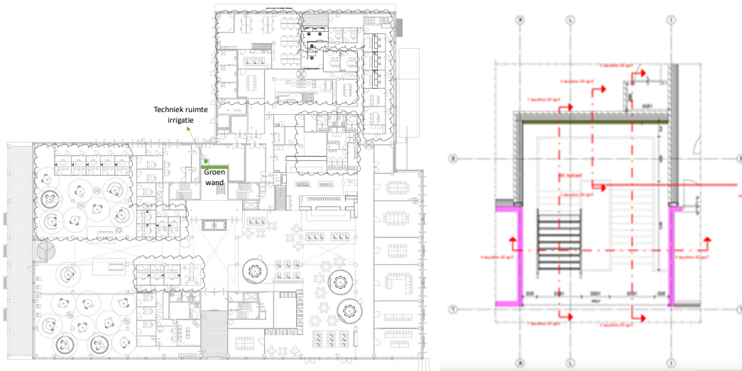
Plattegrond begane grond en detail trap