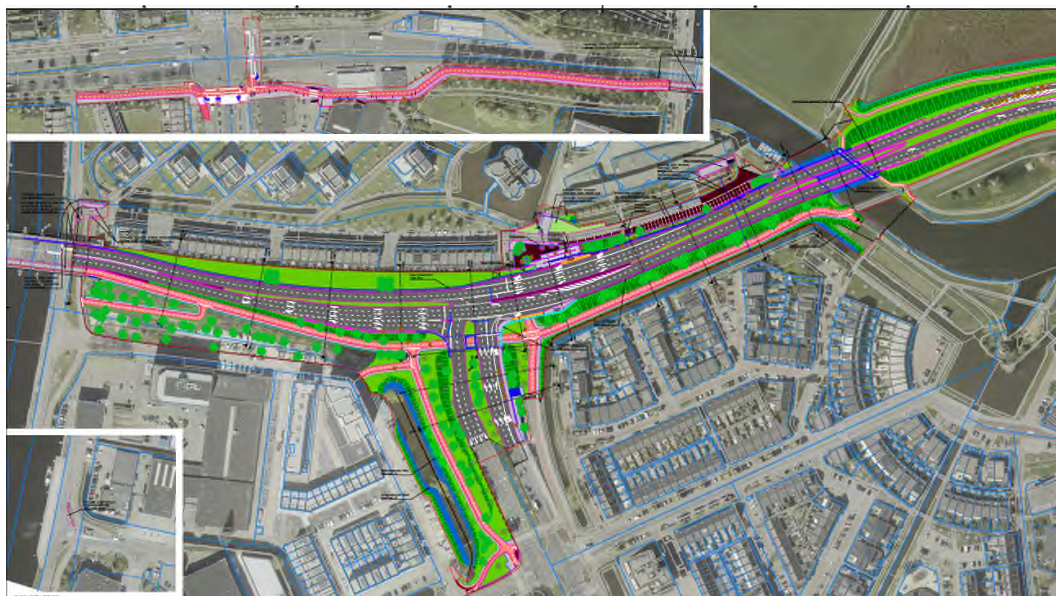
Figuur 2 Engendaal – Oude Spoorbaan kruising.