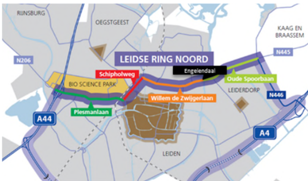
Figuur 1 Overzichtskaart LRN, inclusief de LRN Deeltracé Leiderdorp.

De LRN Deeltracé Leiderdorp vormt een belangrijk onderdeel van het project Leidse Ring Noord (LRN) dat streeft naar een grootschalige verbetering van de verkeersdoorstroming en verkeersveiligheid op de LRN. Zie ook onderstaande figuur.