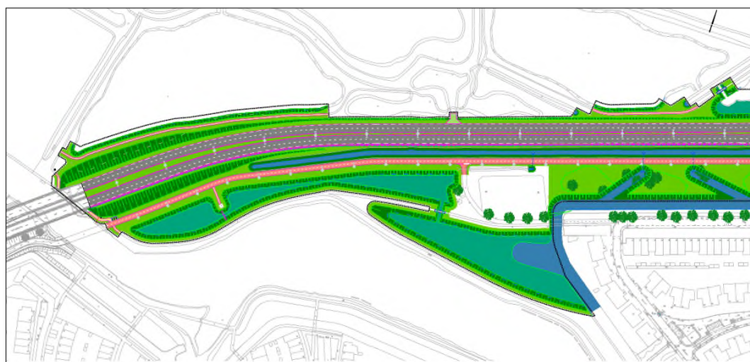
Figuur 3 Na Dwarswatingbrug Oude Spoorbaan tot rotonde Schildwacht.