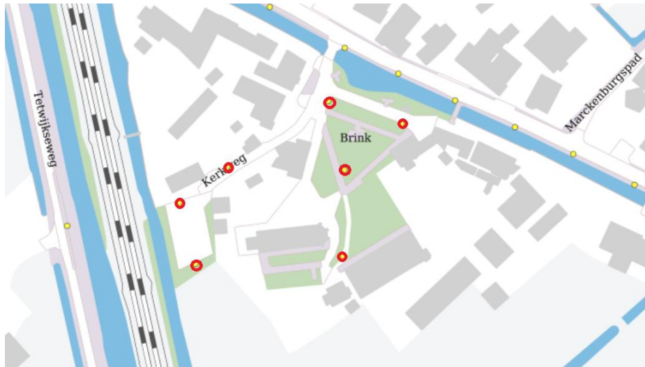
Indicatie historische verlichting De Brink in Schalkwijk