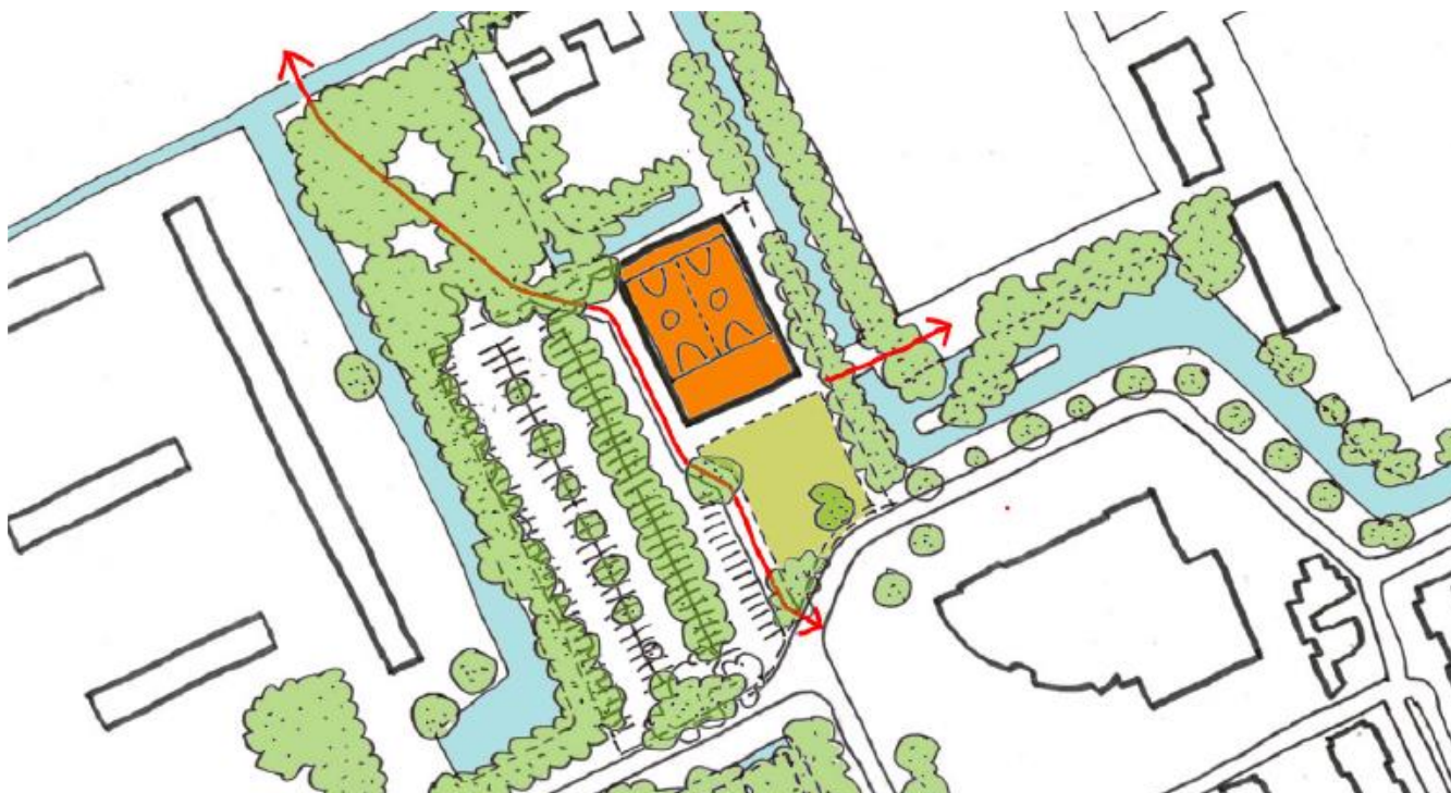
Figuur 1: Locatie Sportzaal aan de Sportlaan te Maassluis