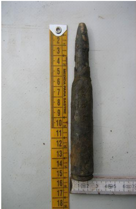
Klein kalibermunitie (geweerpatroon)

De navolgende foto's geven een indruk van de mogelijke soorten aan te treffen explosieven. De afmetingen van munitie (lengte/diameter) variëren van circa 1 cm tot wel 60 cm. Deze beperkte selectie geeft slechts een indruk van veel voorkomende vormen.