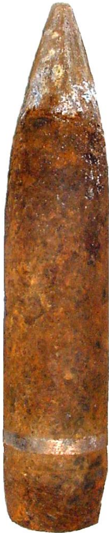
Geschutsmunitie 7,5 cm