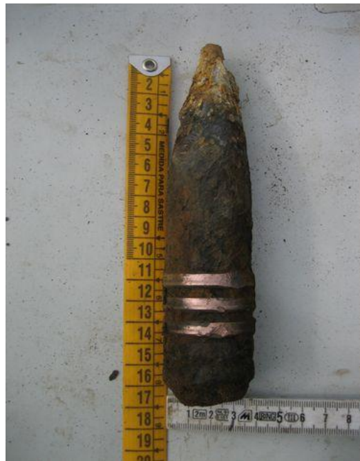
3,7 cm granaat (geschutsmunitie)