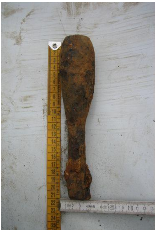
5 cm mortiergranaat (geschutsmunitie)