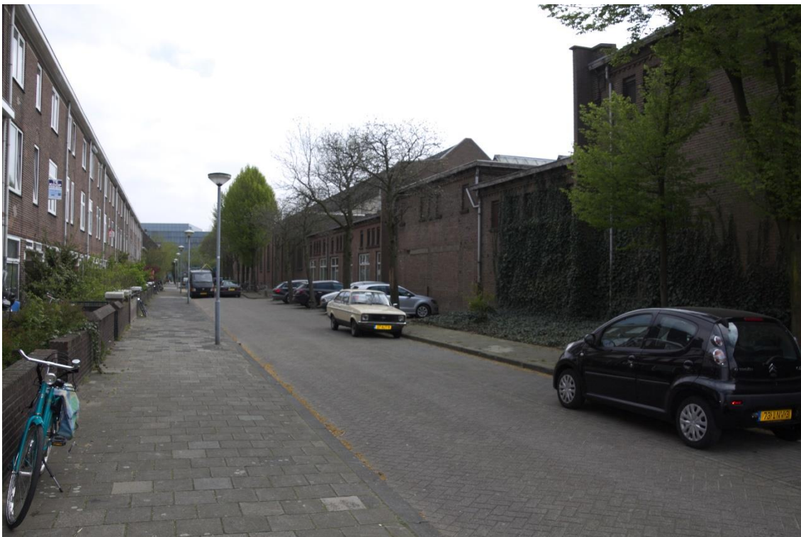
2. Noordgevel, 02