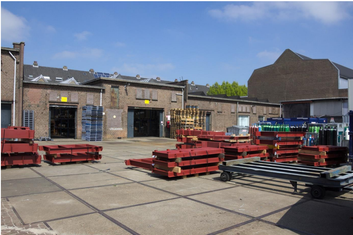
9. Zuidgevel 02