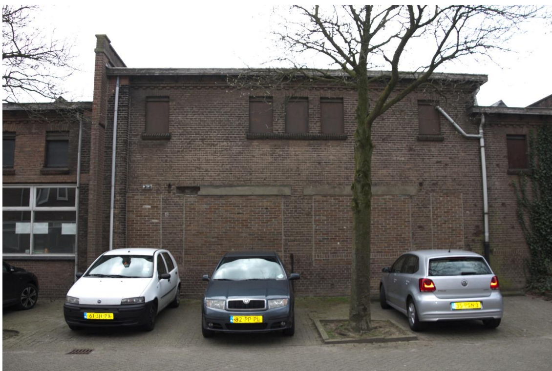
4. Noordgevel fragment, 02