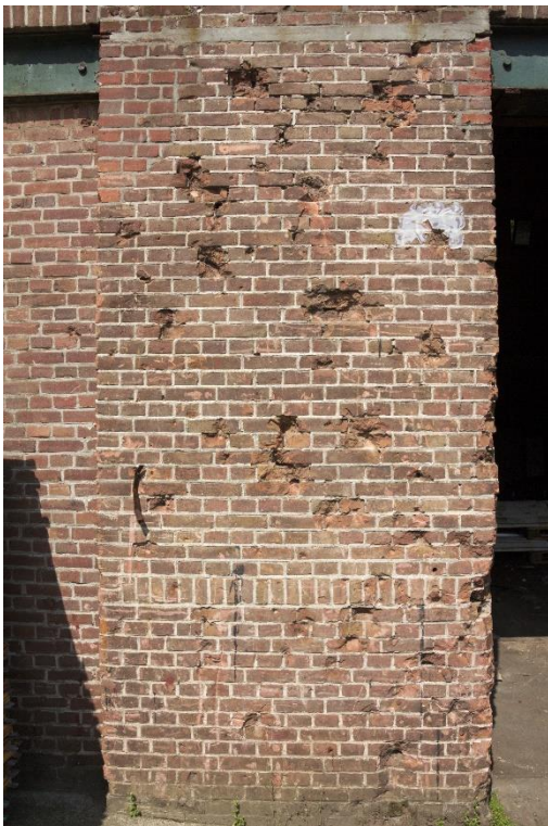
10. Zuidgevel fragment, oorlogsschade