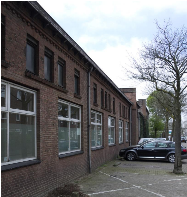
1. Noordgevel, 01