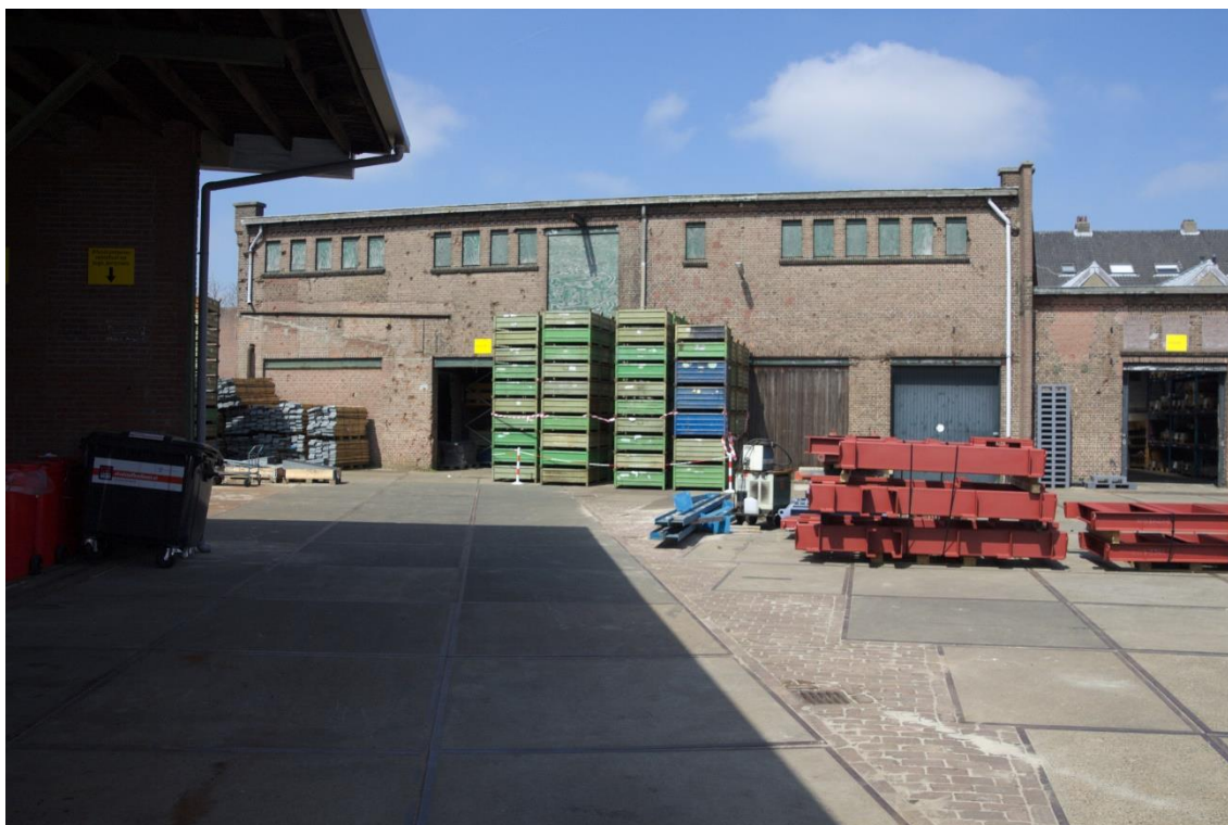
8. Zuidgevel 01