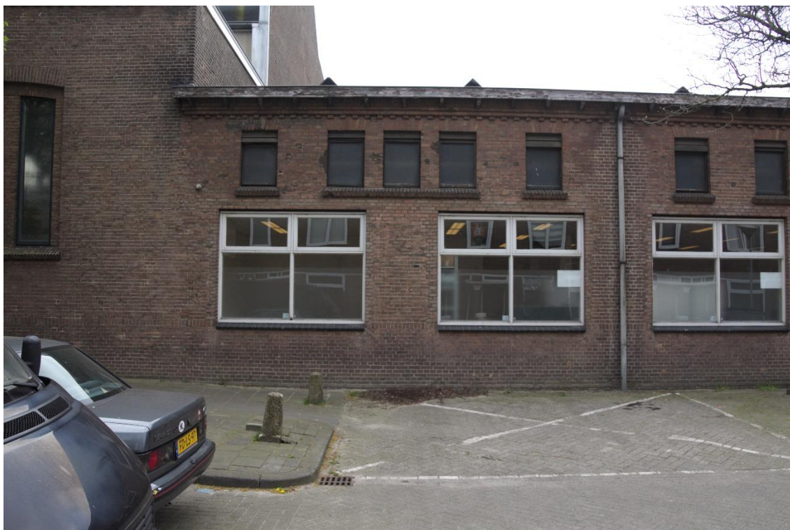
3. Noordgevel fragment, 01