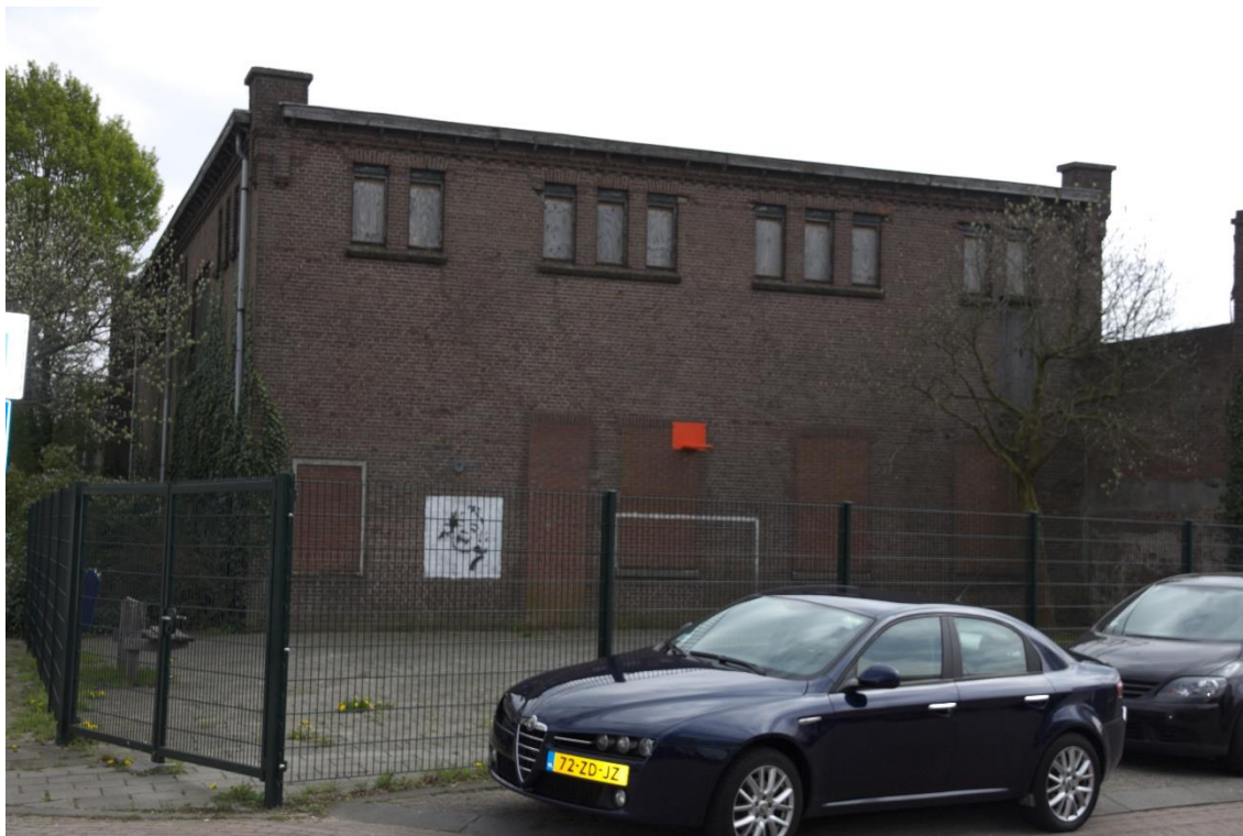
7. Westgevel 01