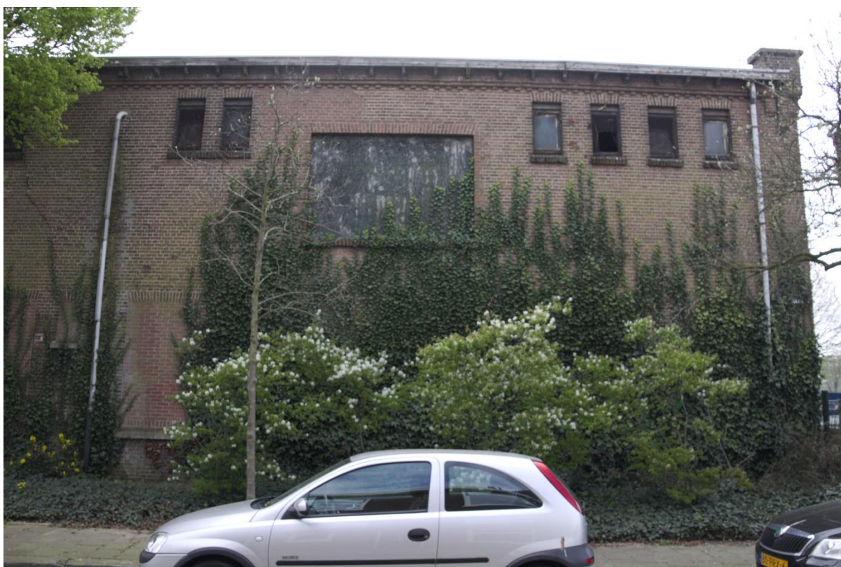
6. Noordgevel fragment, 04