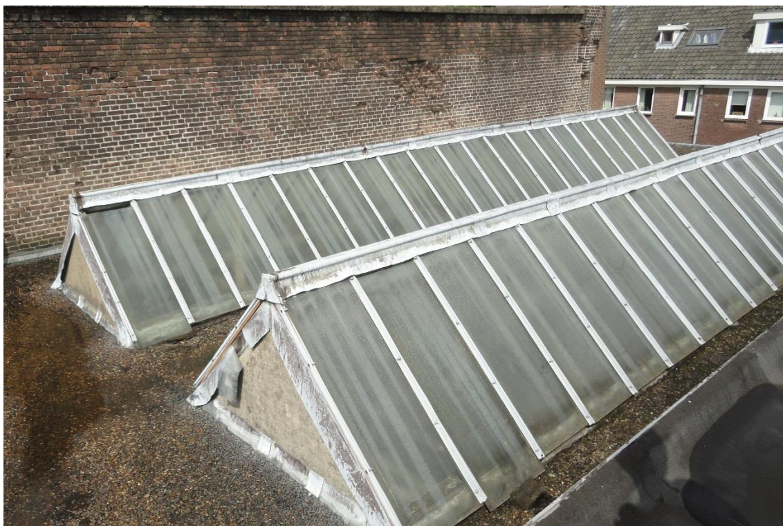
14. Lichtstraat, boven aanzicht