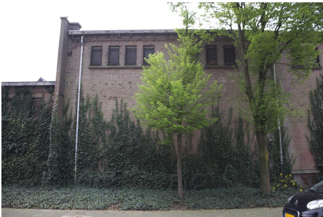
5. Noordgevel fragment, 03