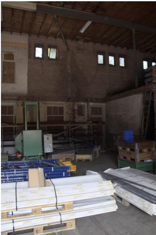
11. interieur, ruimte 03