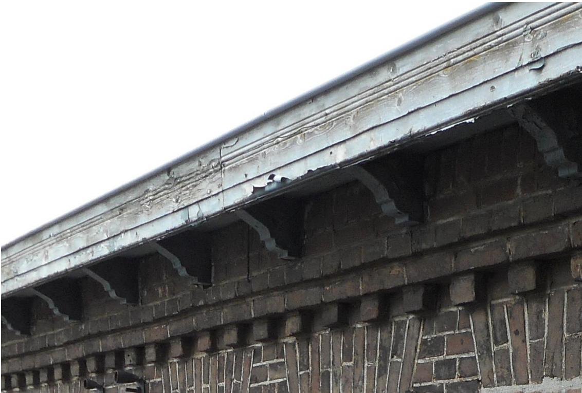
15. Dakrand, detail