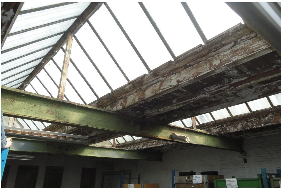
13. Lichtstraat, onder aanzicht