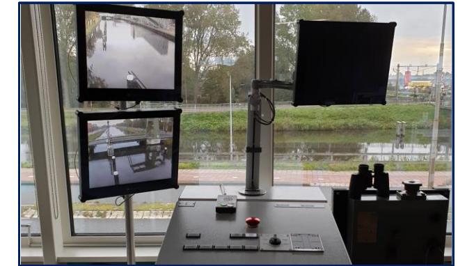
VL Alkmaar (1 werkplek met 1 bedienplek) Spoorbrug Alkmaar