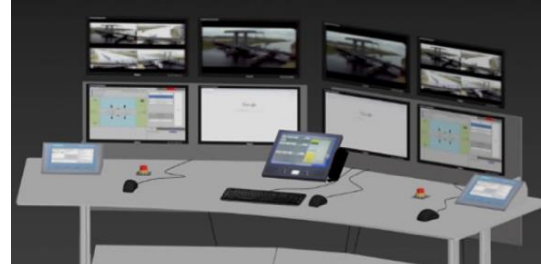
VL Alkmaar (Scope: 1 werkplek met 2 bedienplekken) Bolbrug, Koegrasbrug, Nauernase vaartbrug, Spoorbrug Alkmaar