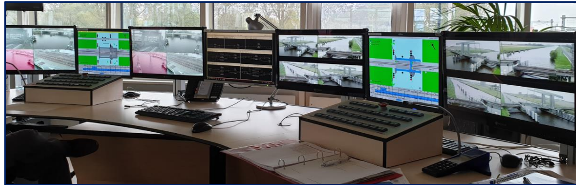
VL Alkmaar (1 werkplek met 2 bedienplekken) Bolbrug, Koegrasbrug, Nauernase vaartbrug