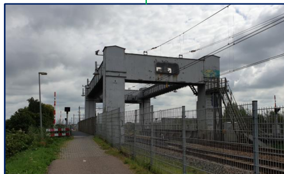
Bolbrug GEO 074