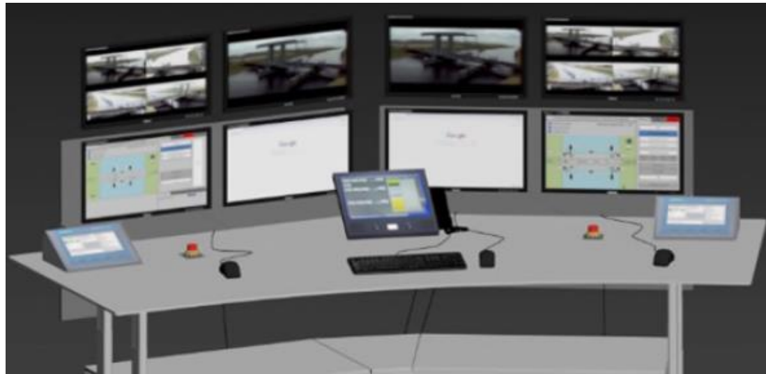
VL Alkmaar (Scope: 1 werkplek met 2 bedienplekken) Bolbrug, Koegrasbrug, Nauernase vaartbrug, Spoorbrug Alkmaar