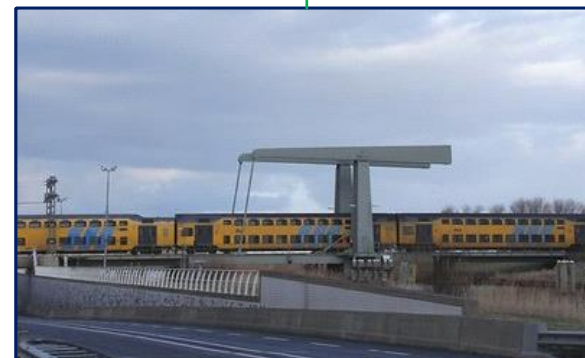
Koegrasbrug GEO 073