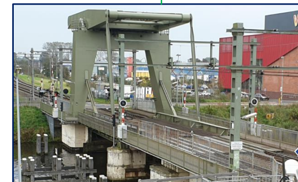
Spoorbrug Alkmaar GEO 620