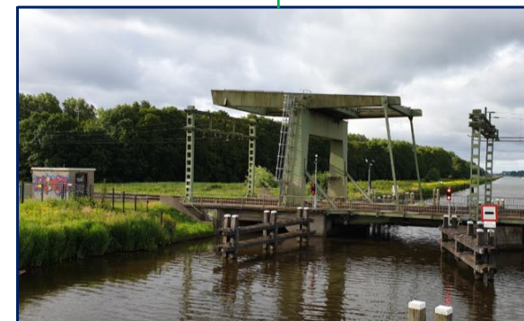
Nauernase vaartbrug GEO 078