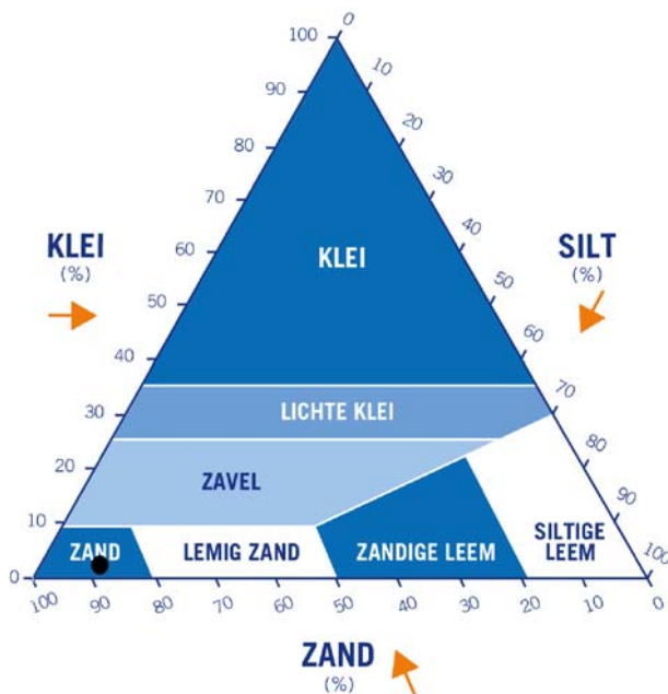
Fysisch Figuur: Textuurdriehoek

Naast klei (lutum), worden ook de silt- en zandfracties weergegeven. Klei is kleiner dan 2 micrometer ( \mu\text{m} ), siltdeeltjes zijn 2-50 \mu\text{m} en zanddeeltjes groter dan 50 \mu\text{m} . De onderlinge verdeling van bodemdeeltjes wordt onder andere gebruikt om het verslempingsrisico van een bodem in te schatten. Bij verslemping wordt de bodem dichtgesmeerd met kleinere deeltjes (klei en silt). Een heel eenzijdige verdeling (bijvoorbeeld hoofdzakelijk zand- of kleideeltjes) levert het minste risico van slemp op. Bij 10-20% klei is het risico op slemp het grootst.