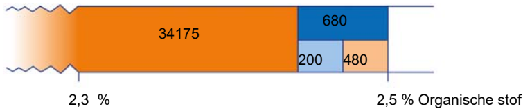
Organische stof Figuur: Organische stofbalans

Jaarlijks afbraakpercentage van de totale voorraad organische stof (%): 2,0