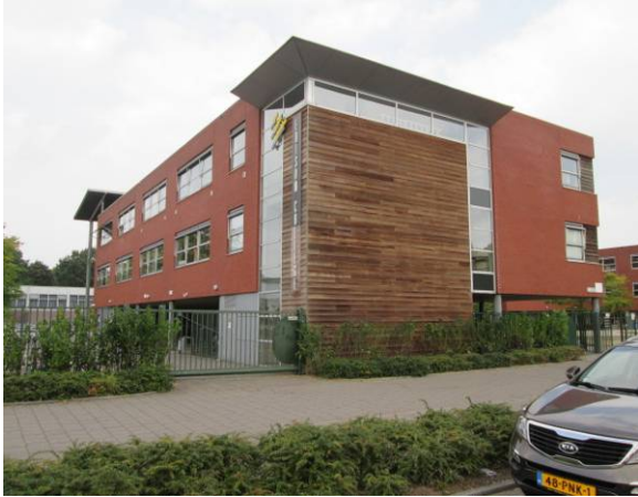
foto 1: Voorgevel schoolgebouw.