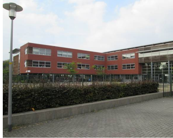
foto 2: Voorgevel schoolgebouw.