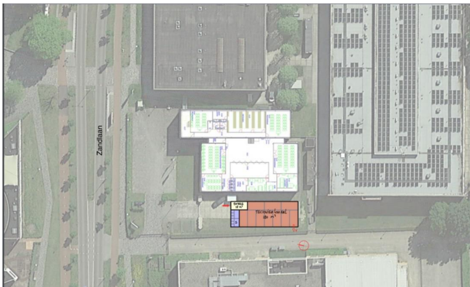
Afbeelding 4: Tijdelijke huisvesting Zandlaan 29a