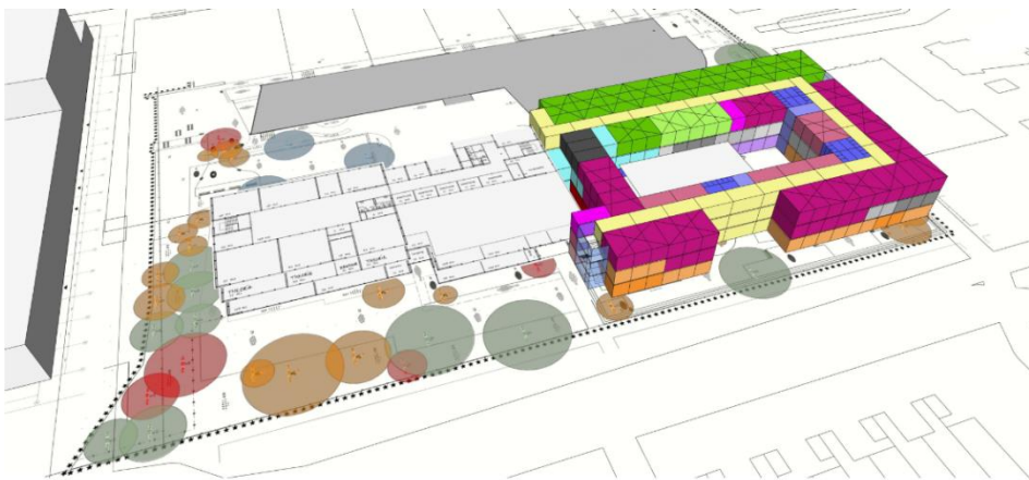
Afbeelding 1: Tijdelijke huisvesting Reehorsterweg 80

Zie onderstaande afbeelding voor de locatie van de huidige locatie en de tijdelijke huisvesting van Dulon.