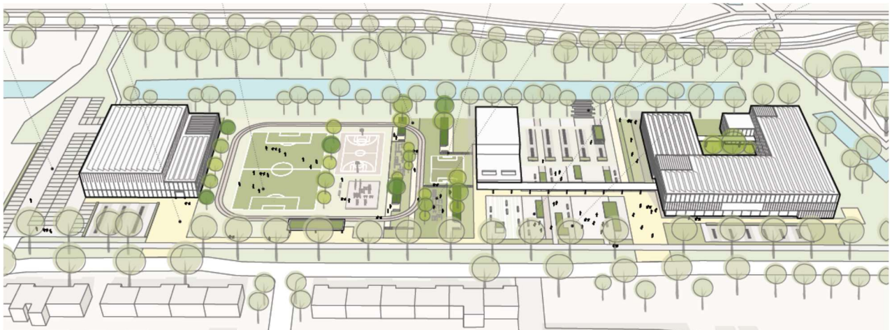
Schematische weergave situatie Jan Ligthartstraat tijdens de afrondingsfase van de opgave (2024/2025)