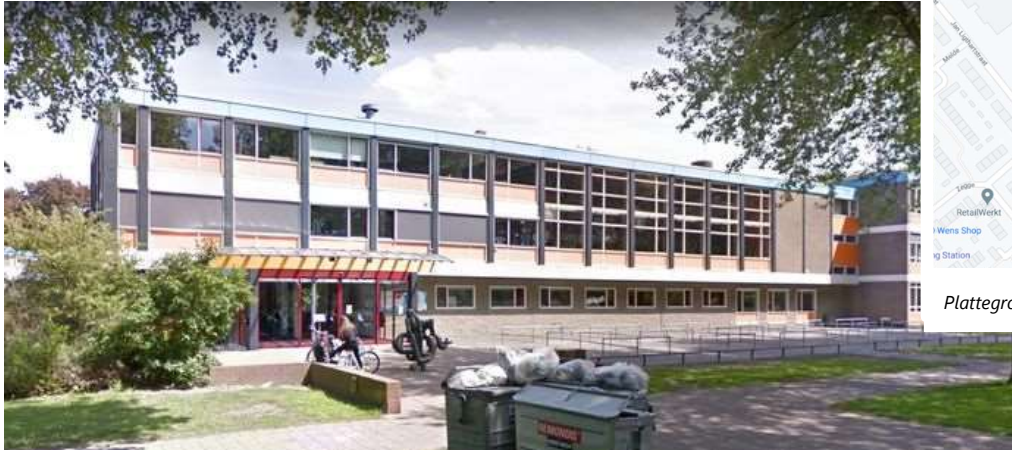
Foto van frontgevel Jan Ligthartstraat 1

Het Ichthus College Kampen is gehuisvest in de schoolgebouwen Jan Ligthartstraat 1, 3 en 5. Het zijn oude schoolgebouwen uit de periode van 1965/1969 die normatief gezien nu te groot zijn. De gebouwen voldoen niet meer aan de eisen van het hedendaagse onderwijs, waar differentiatie, gepersonaliseerd leren en dergelijke gangbaar zijn. Daarbij zijn de gebouwen energetisch zeer ongunstig en kostbaar in de exploitatie.