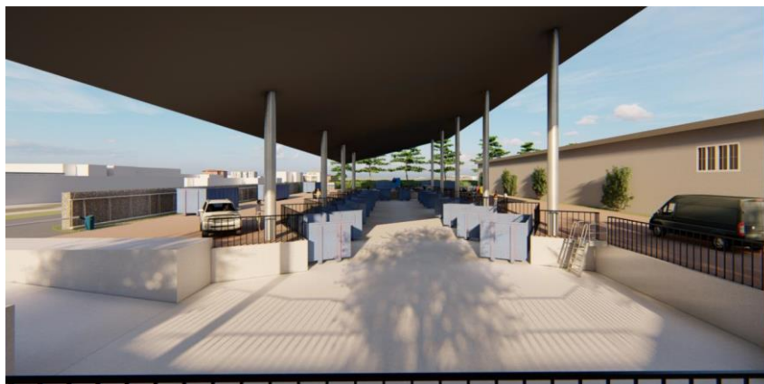
Impressie vloeistofdichte containerkuil onder dak van PV-panelen.

worden onderheid. De op- en afrit naar de containerkuil dient te zijn voorzien van vorst-werende verwarming.