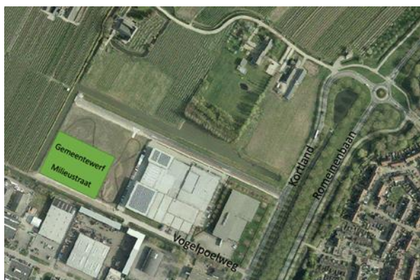
Bedrijventerrein Broekweg Noord / Vogelpoelweg

In onderstaande afbeeldingen is de ligging van de locatie en kavel BN04 (nog te splitsen) opgenomen.