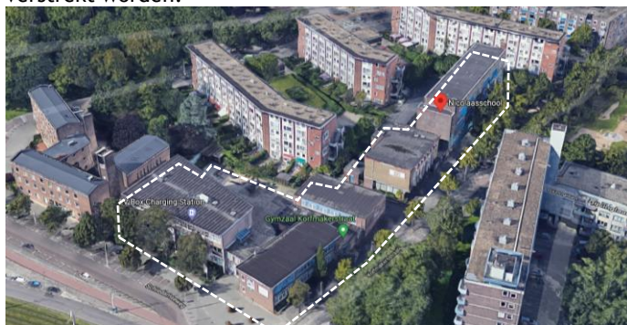
Figuur 1: Locatie Nicolaasschool

Daarnaast is door de Gemeente, met inspraak van de RVKO, een Nota van Uitgangspunten (NvU) opgesteld, waarin de stedenbouwkundige randvoorwaarden zijn opgenomen voor het project en de architectonische beeldkwaliteit wordt omschreven. Deze NvU is leidend voor het uiteindelijke ontwerp en zal aan geselecteerde partijen in de gunningsfase verstrekt worden.