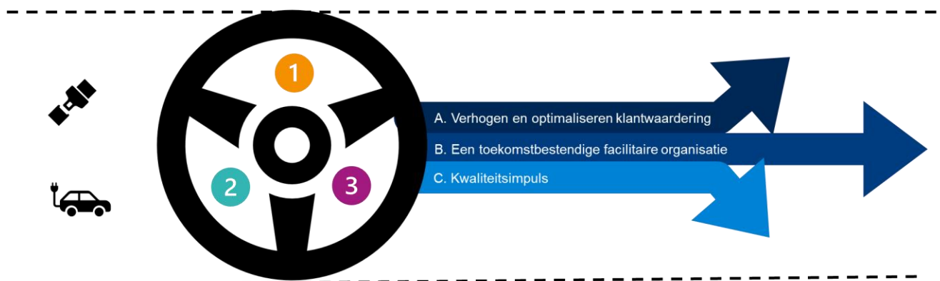
Figuur 2. De route van het Multi services model

CBR wil samen met Inschrijver het Multi services model vormgeven. Om ervoor te zorgen dat er een kwalitatief goede, beheersbare dienstverlening komt te staan is het van belang dat CBR en Inschrijver samen de juiste route nemen. Hiervoor heeft het CBR twee voorwaarden, drie doelen en drie resultaten opgesteld. De beoogde route is in figuur 2 visueel weergegeven.