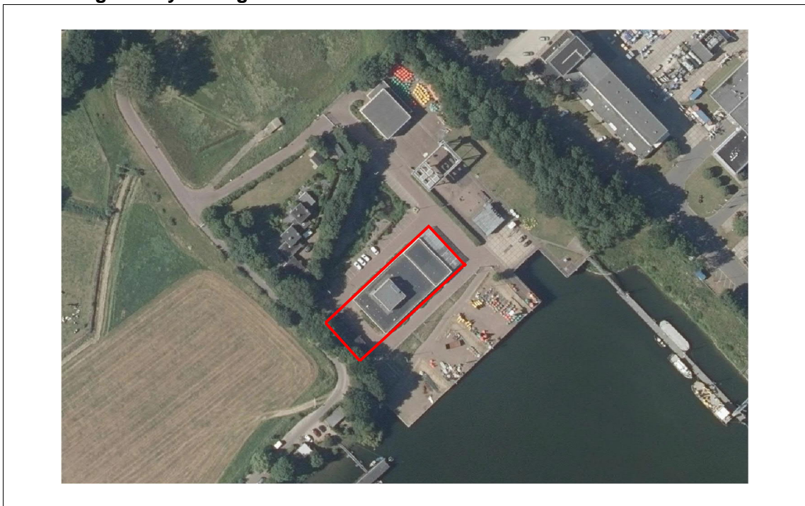
Afbeelding 3.1 Systeemgrenzen

Het terrein binnen de werkgrenzen is het werkterrein. Gedurende de realisatiefase van het systeem nieuwbouw watersteunpunt Arnhem heeft de Opdrachtnemer de kosteloze beschikking over de oppervlakten van grond en water van het werkterrein, zolang de uitvoering van de Werkzaamheden dit nodig maakt. Het is zonder toestemming van Opdrachtgever niet toegestaan om buiten het werkterrein oppervlakten van grond en/of water te gebruiken als werkterrein.