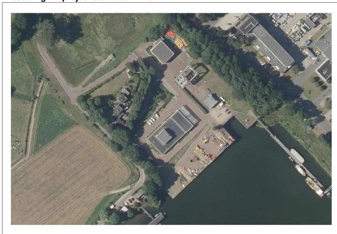
Afbeelding 2.1 projectlocatie te Arnhem

Rijkswaterstaat heeft ervoor gekozen om voor deze locatie nieuwbouw te realiseren. Voor deze nieuwbouw is door Witteveen+Bos een Voorlopig Ontwerp (VO) gemaakt. Doel van dit project is om dit ontwerp verder uit te ontwerpen en te realiseren.