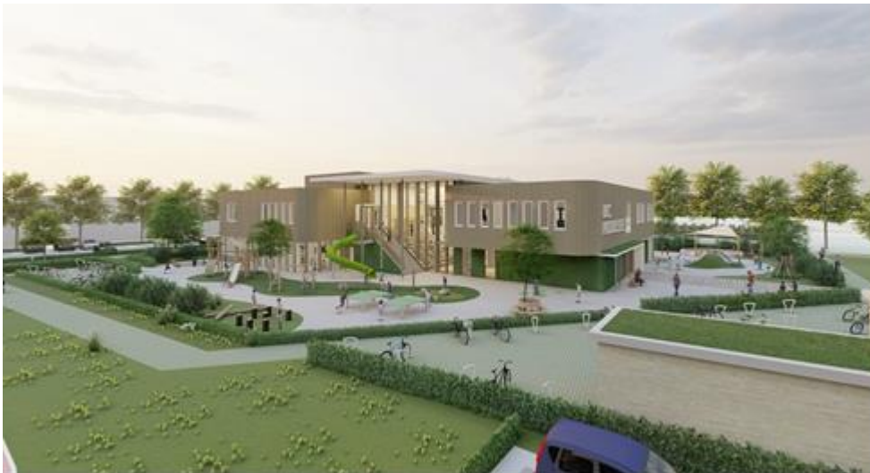
Afbeelding 1: Gebouwimpressie