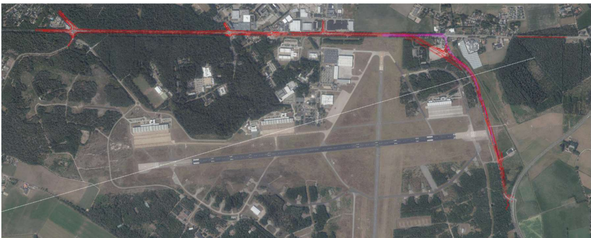
Figuur 1.1 – Overzicht van de projectlocatie

Zoals nu bekend is de start van de werkzaamheden voorzien voor april 2022 en de eindoplevering voor maart 2023.