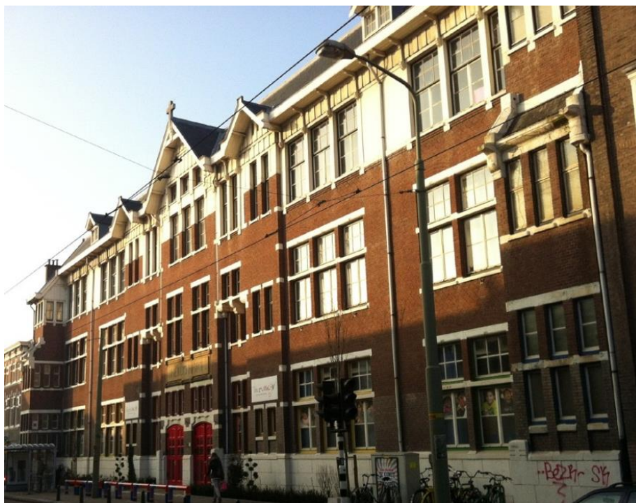
Afbeelding 2: Te renoveren voorgevel van het complex aan de Beeklaan 184

Ten behoeve van de realisatie van het werk wordt het door het ontwerpteam (onder leiding van architectuurstudio DP6) vervaardigde ontwerp met STABU-Bestek in de markt gezet met het voornemen een ervaren aannemer te contracteren. De voertaal in het project (en tijdens de aanbesteding) is Nederlands. De Opdracht wordt uitgevoerd op basis van een contract waarop de Uniforme Administratieve Voorwaarden (UAV 2012) van toepassing zijn.