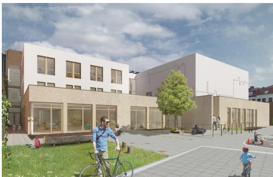
Afbeelding 3: Impressie van de nieuwe situatie (binnenterrein) aan de Beeklaan 184