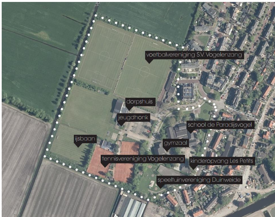
Afbeelding 2: Ligging elementen in Plangebied

Het grenst aan de noord-, westen zuidkant aan het open landschap met in het zuiden bollen velden die typerend zijn voor dit gebied. Aan de zuidkant ligt het plangebied aan de gemeentegrens van de gemeente Hillegom en Bloemendaal. Het dorps huis en de onder 2. genoemde onderdelen, alsmede een in het plangebied aanwezig pompemaal van het Hoogheemraadschap van Rijnland, maken nadrukkelijk geen onderdeel van de onderhavige grondverkoop.