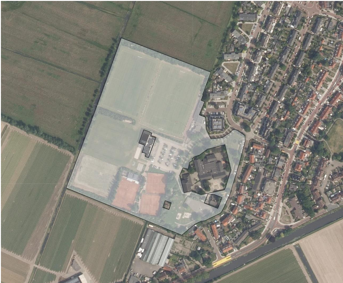
Afbeelding 3: Indicatie uitgeefbaar gebied

Afbeelding 3 weergeeft indicatief het uitgeefbaar gebied in het Plangebied. Hierbij dient opgemerkt te worden dat het niet-gemarkeerde buitengebied rondom de Paradijsvogel, exclusief het schoolplein, nadrukkelijk wel onderdeel uitmaakt van de gebiedsontwikkeling en de herinrichting van de (openbare) ruimte door de ontwikkelaar. De gemeente is ten tijde van schrijven van dit document met Jong Leren in overleg over de wijze van het betrekken van daadwerkelijke uitgifte van dit gebied en het al dan niet volledig openbaar stellen hiervan. Uitgangspunt is dat het schoolplein geen onderdeel uitmaakt van de opgave, maar het gebied daar direct omheen wel. De herontwikkeling van het gebied rondom de Paradijsvogel maakt dan ook onderdeel uit van de Opdracht.