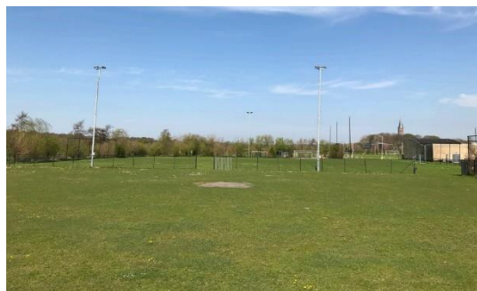
Afbeelding 4 en 5: Het sportcomplex van TVV (links) en van SVV (rechts)