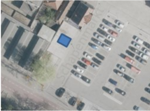
Afbeelding 1. Locatie op de Schapenmarkt (In het blauw het toilet)

De exacte locatie van de toiletvoorziening zal na gunning worden overlegd met de gemeente. Nutsvoorzieningen rondom de locatie zijn aanwezig, maar dienen nog naar de exacte locatie geleid te worden (onderdeel van de opdracht). Op de te gebruiken locatie is een betonplaat gesitueerd die in overleg zou kunnen worden verwijderd door opdrachtgever.