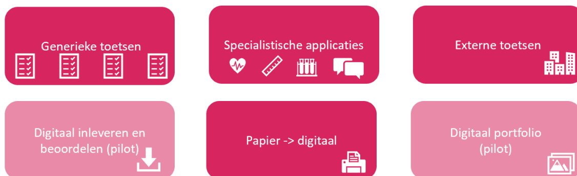
Figuur 2: Huidige situatie landschap digitaal toetsen

Uit onderzoek naar toetsapplicaties die binnen Hogeschool Rotterdam gebruikt worden is een beeld naar voren gekomen van een divers landschap, te categoriseren in een aantal hoofdonderdelen, zie Figuur 2: Huidige situatie landschap digitaal toetsen.