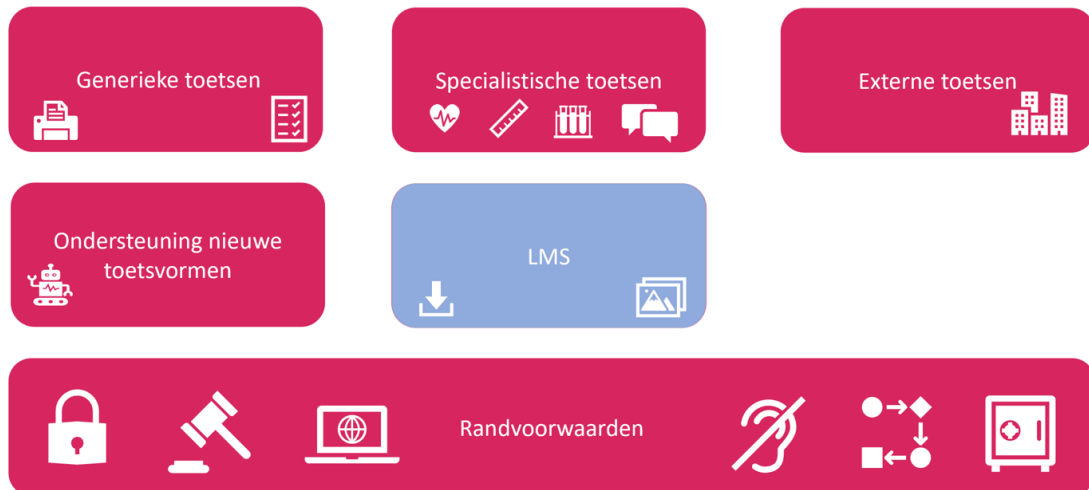
Figuur 3: Toekomstige situatie landschap digitaal toetsen

In de beoogde nieuwe situatie is ook ruimte voor de ‘ ondersteuning van nieuwe toetsvormen ’, zoals bijvoorbeeld toetsen met VR, programmatisch toetsen, etc.